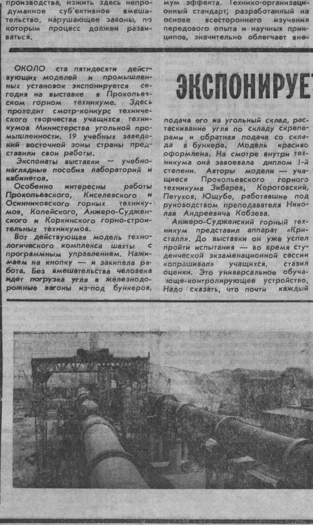
ОКОЛО ста пятидесяти действующих моделей и промышленных установок экспонируется сегодня на выставке в Прокопьевском горном техникуме. Здесь проходит смотр-конкурс технического творчества учащихся техникумов Министерства угольной промышленности. 19 учебных заведений восточной зоны страны представили свои работы. Экспонаты выставки — учебно-наглядные пособия лабораторий и кабинетов. Особенно интересны работы Прокопьевского, Киселевского и Осинковского горных техникумов, Колыевского, Анжеро-Судженского и Коржинского горно-строительных техникумов. Вот действующая модель технологического комплекса шахты с программным управлением. Нажимем на кнопку — и закипела работа. Без вмешательства человека идет погрузка угля в железнодорожные вагоны из-под бункеров.