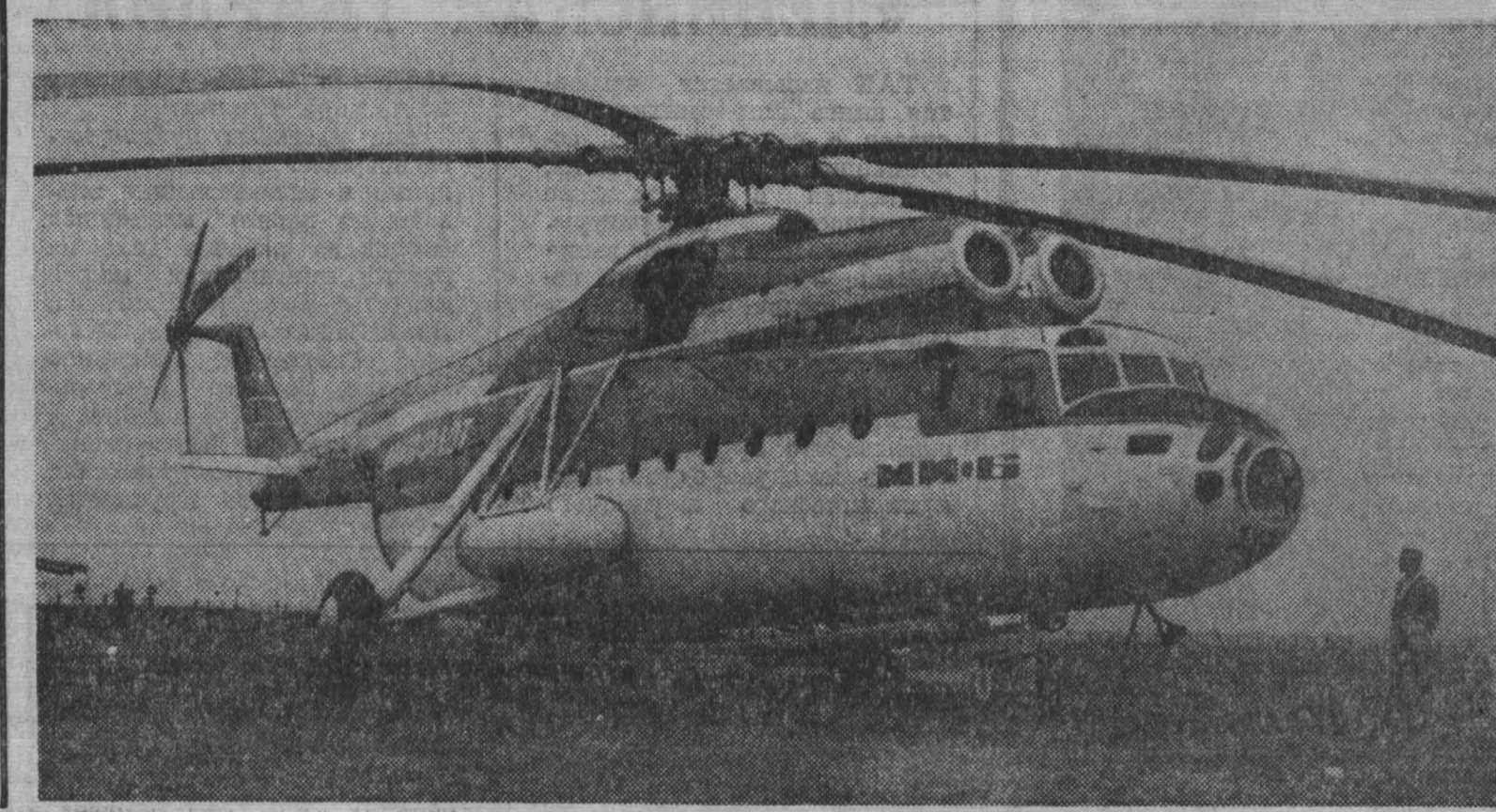
В Париже проходила международная авиационная выставка вертолет «Ми-6».

УИКЕНД — это конец недели. Суббота и воскресенье. На уикенд в Нью-Йорк приезжают из расположенных неподалеку воинских частей несколько тысяч солдат.