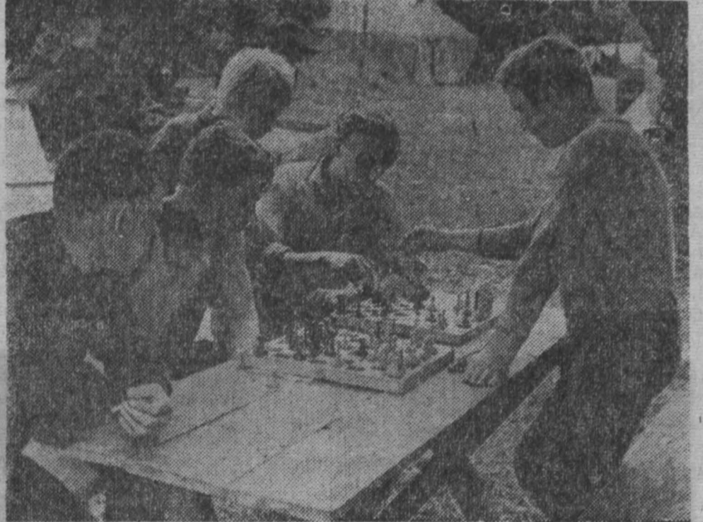
На снимках: Палаточный городок сортопрокатного цеха. Каждый отдыхает по своему.