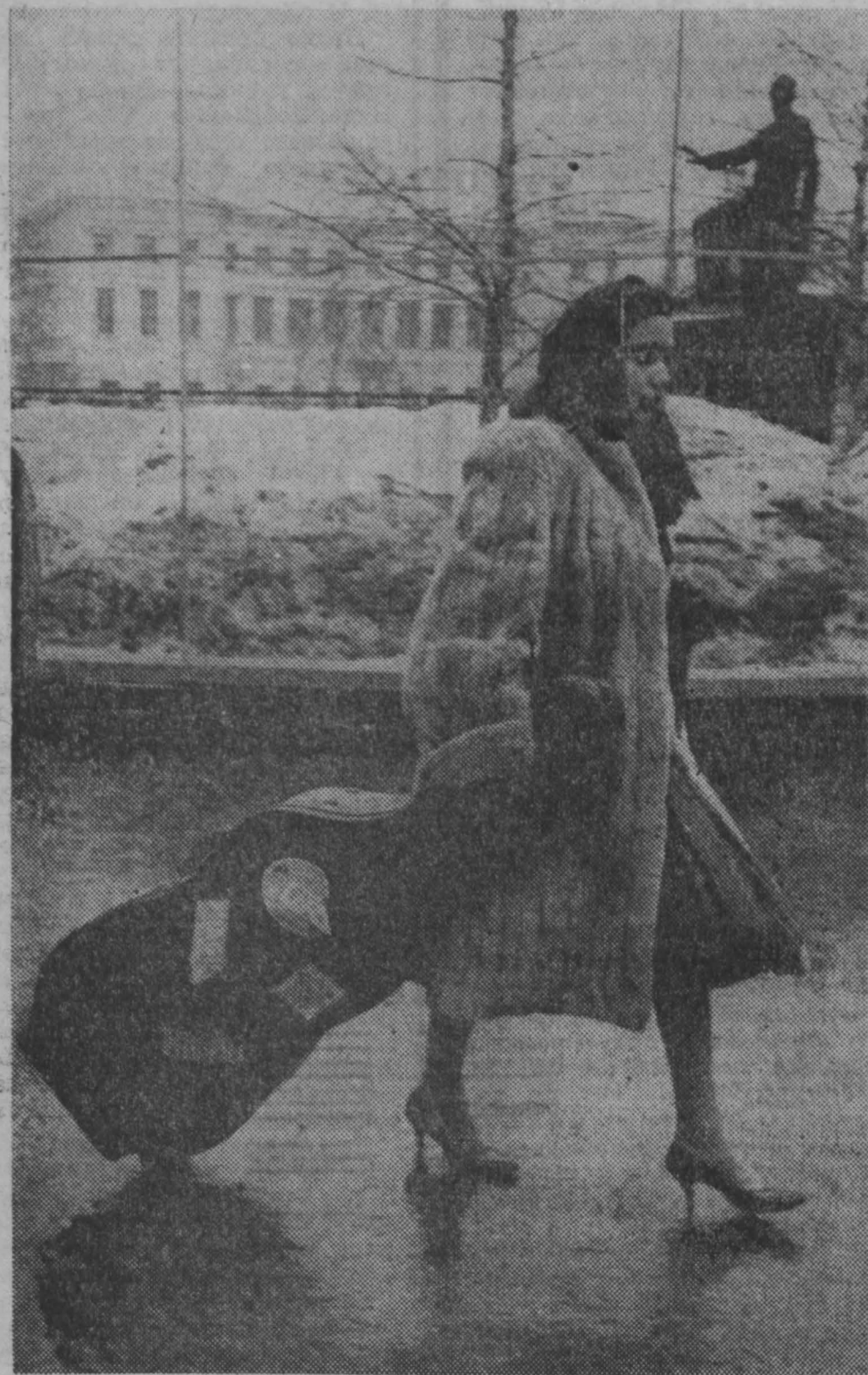
А. Козьков. «Финаско».