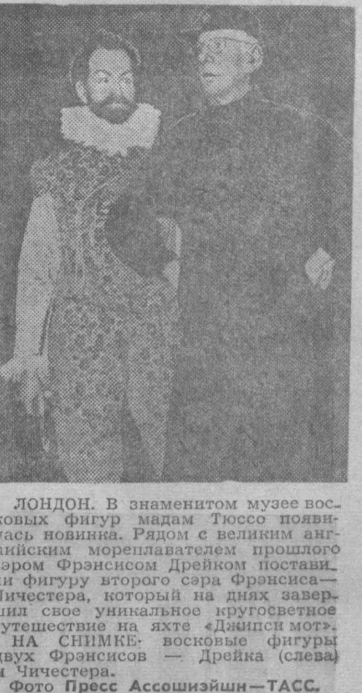
ЛОНДОН. В знаменитом музее последних фигур мадам Тессе появились женщины. Рядом с великим английским мореплавателем прошлого сиром Франсисом Дрейком поставили фигуру второго сара Франсиса — Чичестера, который на днях завершил свое уникальное кругосветное путешествие на яхте «Джайлс Мотт».