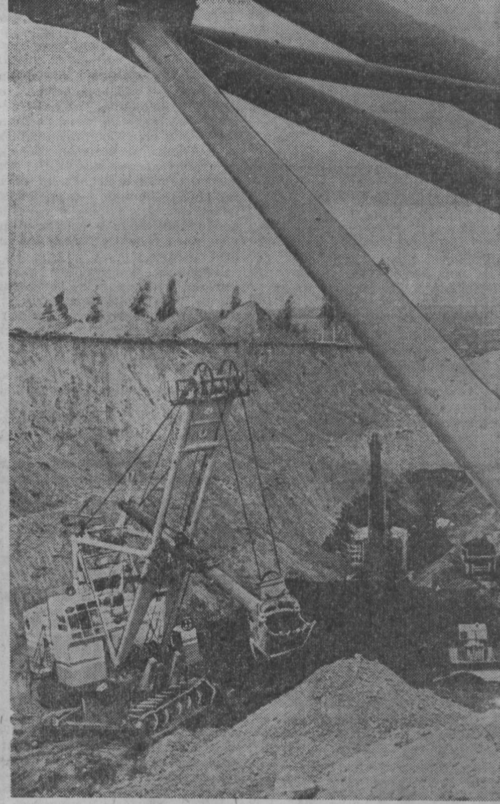
Московский карьер — самое молодое предприятие Кузбасса и к тому же высокоавтоматизированное. Не случайно здесь применяется бестранспорный способ разработки. На СНИМКЕ: горные работы на втором участке Московского карьера.