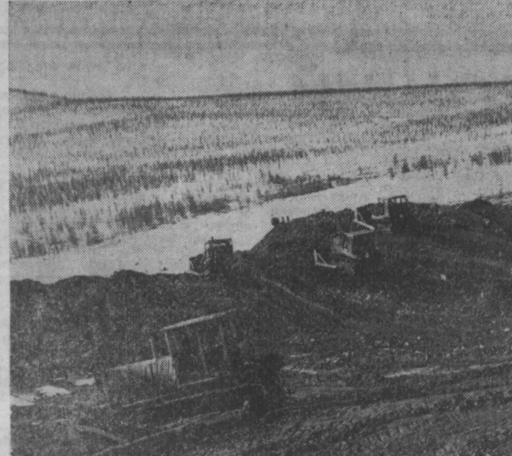
Рядом с Билибино — крупным центром золотообывающей промышленности Советского Союза на Чукотке строится атомная электростанция. Она даст тон шахтам и рудникам, поселкам и городам этого сурового, но щедро наделенного природными богатствами края. Сейчас на строительстве ведутся земляные работы — планируются территория под основания промышленных объектов. На СНИМКЕ: планировочные работы на строительстве Билибинской атомной электростанции. 1967 г.