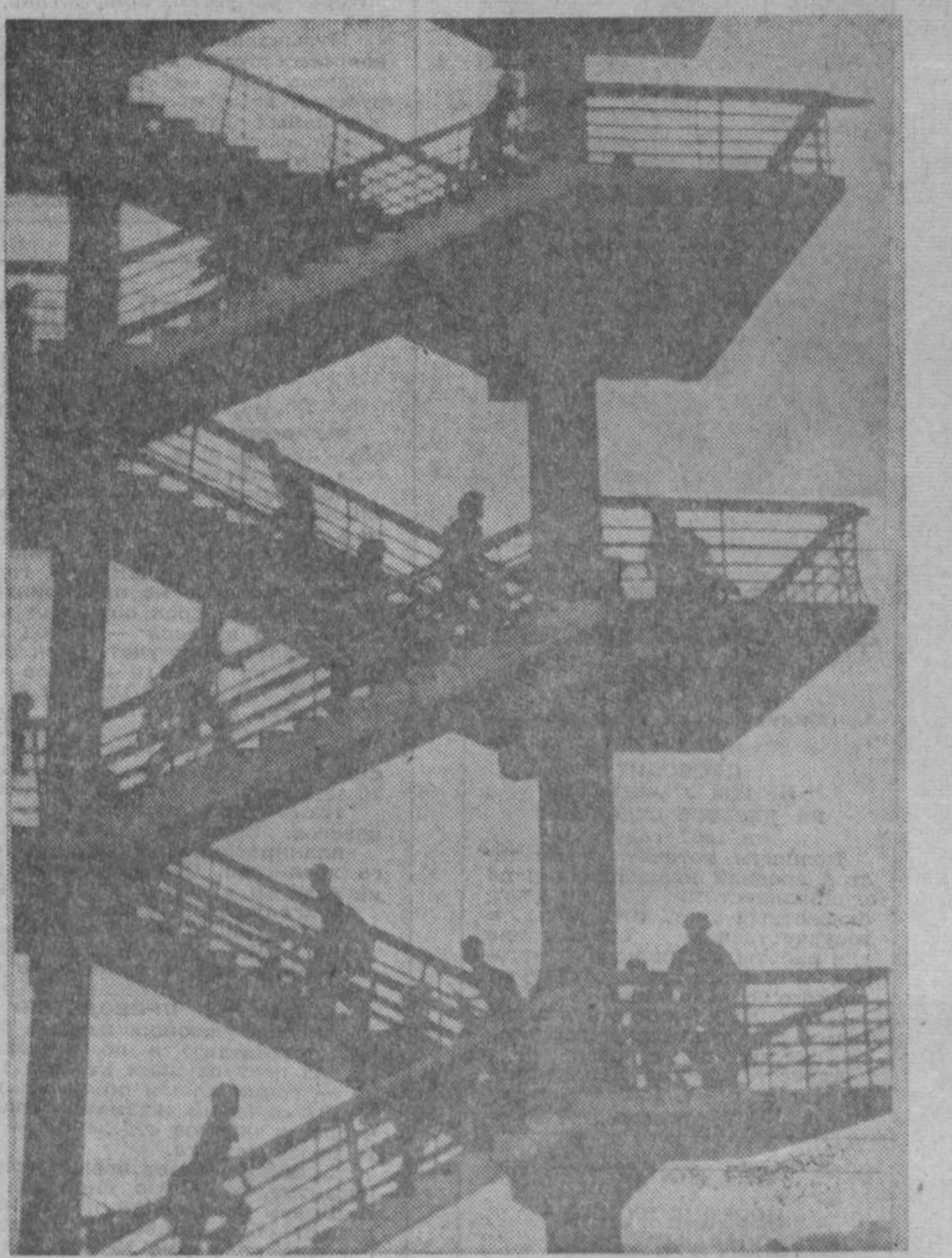
Демократическая Республика Вьетнам. Ханой. Воздушная тревога. Войска противовоздушной обороны занимают свои боевые посты.

Сообщая об этом, американский журнал «Ю. С. Нюз энд Уорлд Репорт» пишет, что для удовлетворения просьбы генерала было бы необходимо провести в стране мобилизацию и призвать резервистов.