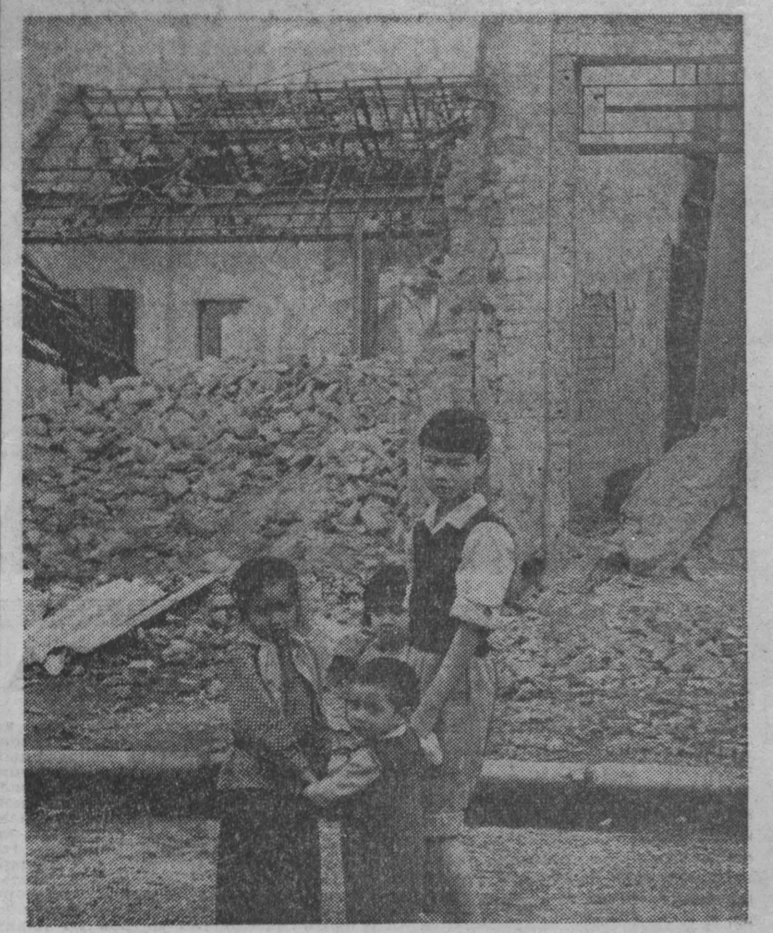
В одном из кварталов Ханоя, разрушенных американскими бомбардировщиками. 1967 г.

Мендес и занял президентское кресло, реальная власть осталась у армии, и он стал ее лучшим орудием. Он выдал гонимым в Гватемале истребителям свободу и свободу.