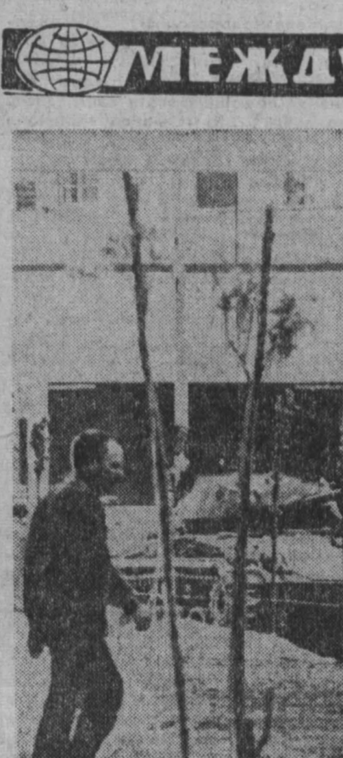
В Греции сохраняется напряженная обстановка. Улицы Афин и других городов патрулируются танками.

в Греции сохраняется напряженная обстановка. Улицы Афин и других городов патрулируются танками.