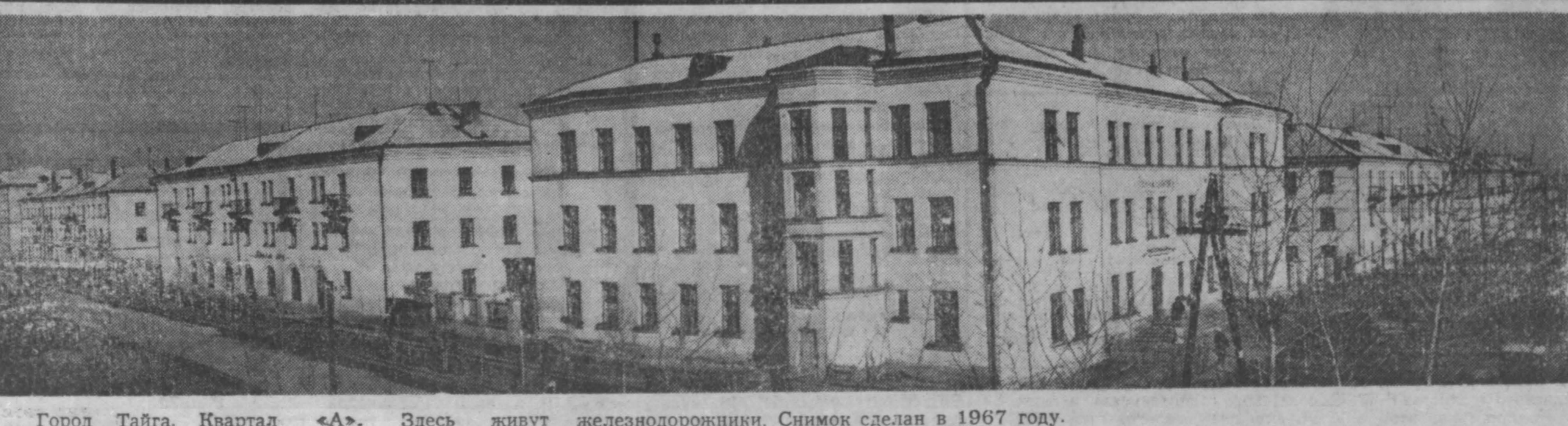
Город Тайга. Квартал «А». Здесь живут железнодорожники. Снимок сделан в 1967 году. Общий вид поселка Тайга. Снимок (справа) сделан в 1899 году.