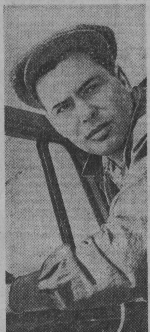
Шесть тысяч тонн товарного квартита сверх плана организовали добыть труженники Антоновского рудника в юбилейный год.