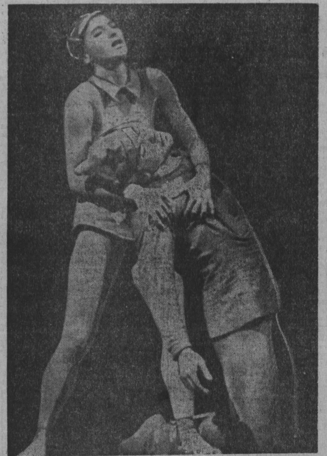
ЛЕНИНГРАД. В Академическом Малом театре оперы и балета состоялась премьера балета по одноименной повести А. Толстого «Гадюка».