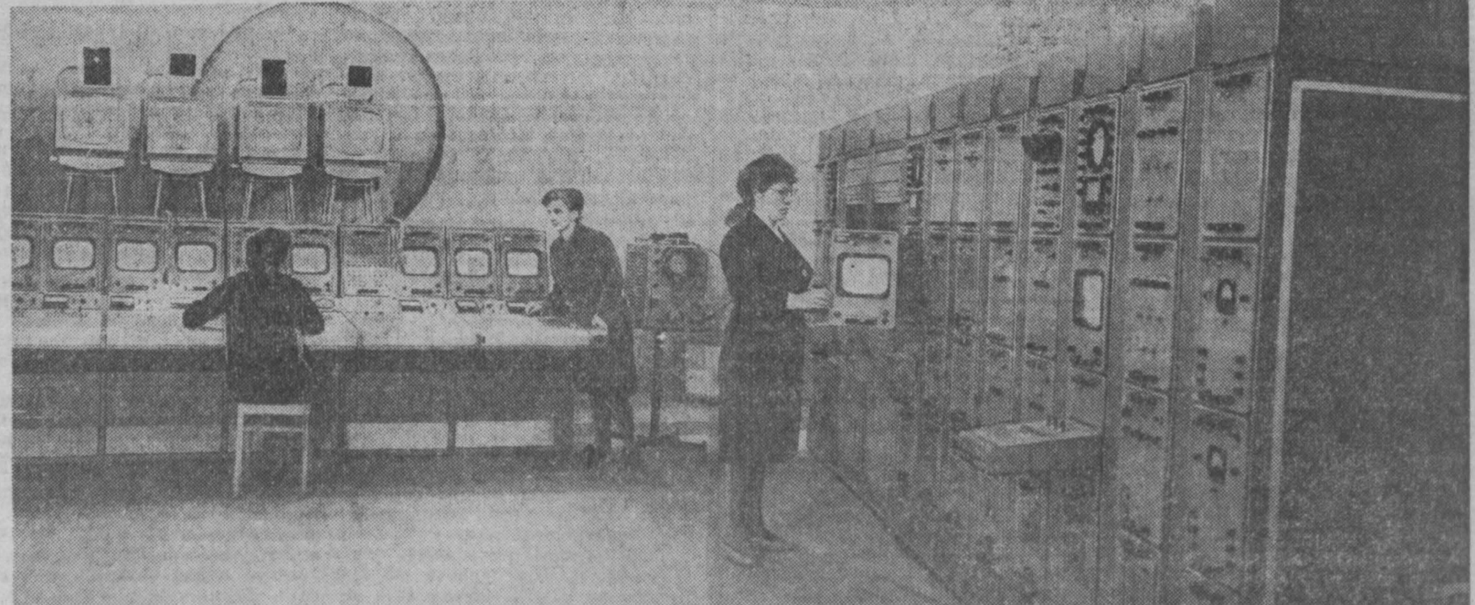
МОСКВА. Тысячи монтажников, строителей, отделочников, специалистов связи работают сейчас на строительстве Останкинского телецентра и телевизионной башни, которое намечено завершить к 50-летию Великого Октября. Сейчас в помещении телебашни идет наладка телевизионных передатчиков, которые будут вести передачи по 1, 3, 8 и 11 каналам Центрального телевидения, закончен монтаж передатчиков частной модуляции, полностью оборудованы аппаратные междугородных входных и выходных линий, аппаратная городских трансляций.

МОСКВА, 15 мая. (Корр. ТАСС). Работе школьных инспекторов посвящен всероссийский семинар ведущих роно и инспекторов республик.