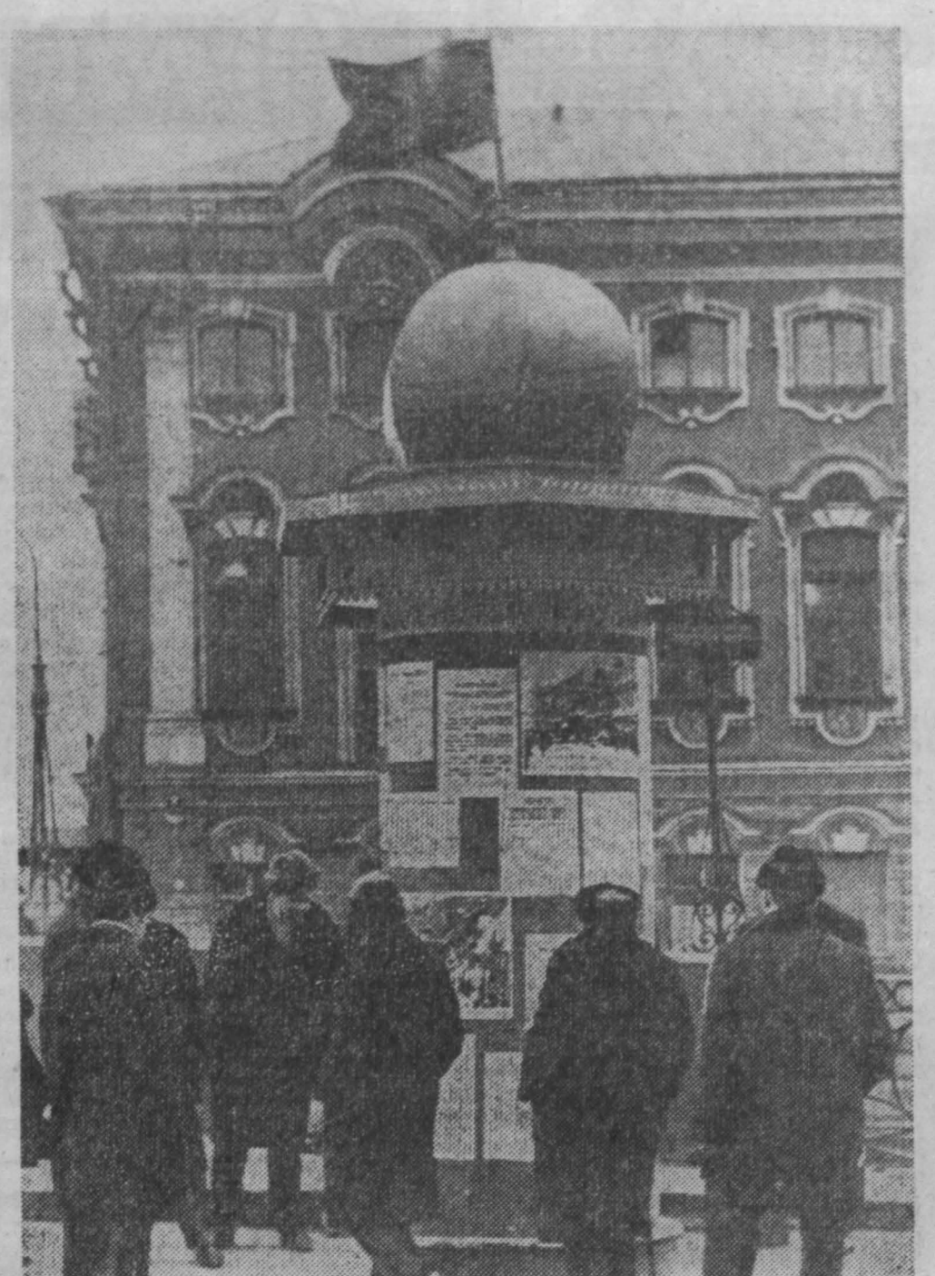
Недавно я провел свой отпуск в Ленинграде. Многие мне понравились здесь. Ленинградцы очень активно готовятся к 50-летию Великого Октября. Во всем чувствуется приближение праздника. Сейчас можно немало интересных узнать о днях, когда революция только начиналась. Вот обыкновенные афишные тумбы. А плакаты на них — бурного октября 1917 года. О настоящем рассказывают фотографии «Ленкасс». На снимке: афишские тумбы с плакатами 1917 года. Фото и текст Н. Мануйлова.