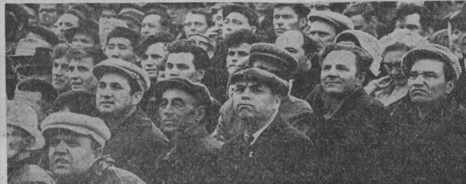
...а во втором тайме зрители в основном скучали.