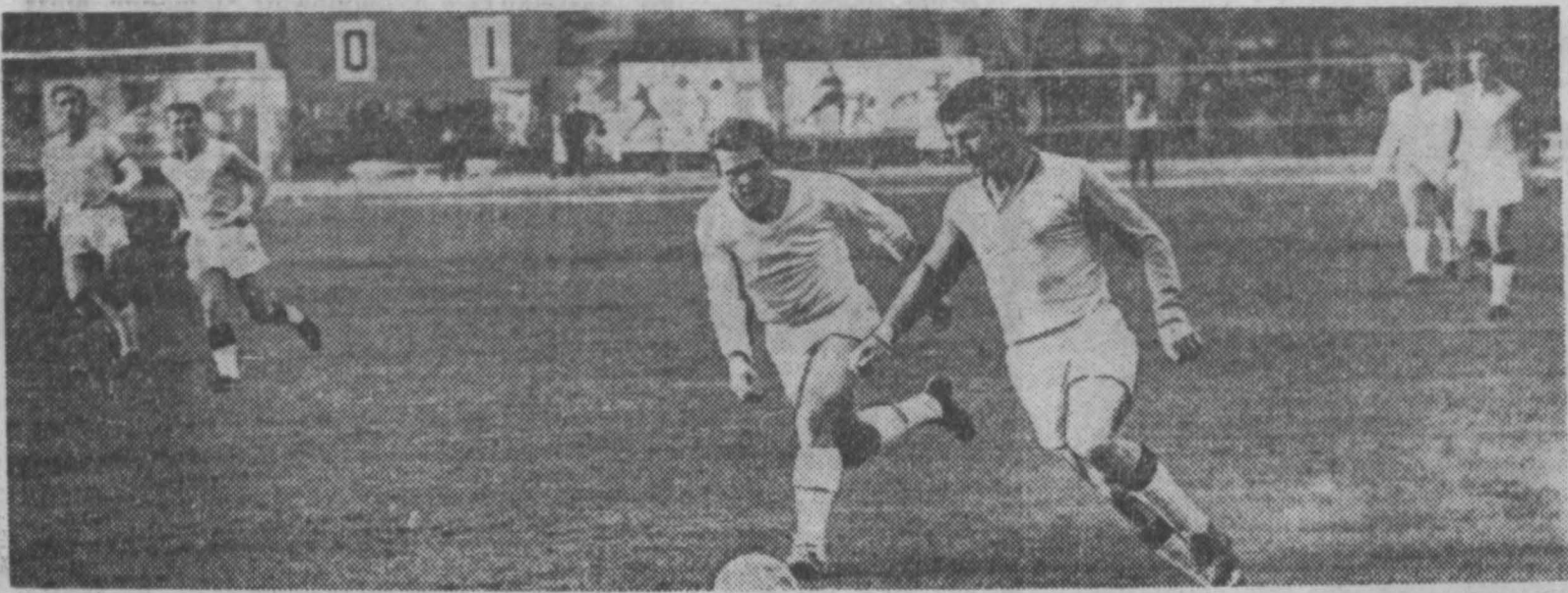
При счете 0:1 «Кузбасс» еще атаковал...