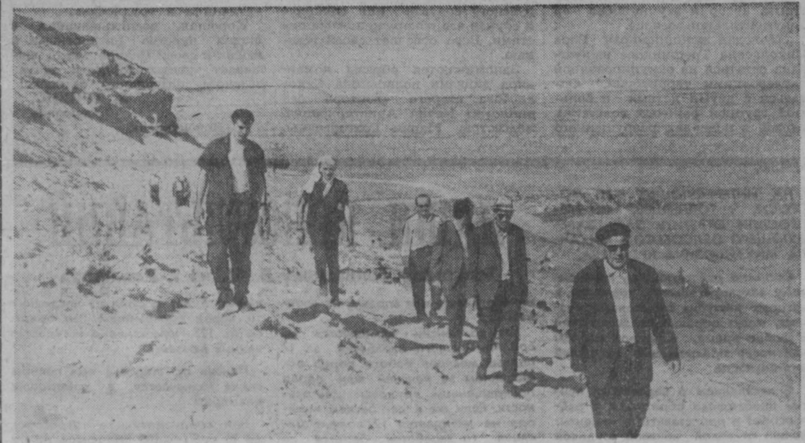
В ДЕКАБРЕ 1966 года в Дамаске было подписано соглашение об оказании Советским Союзом экономической и технической помощи в области строительства первой очереди гидроэнергетического комплекса на реке Евфрат. Сейчас сотрудники института Гидропроект подготовили проектные чертежи для будущей стройки. Сейчас 40 миллионов кубических метров грунта придется переместить строителям этого комплекса и свыше 1 миллиона бетона уложить в тело плотины, предполагаемая высота которой будет около 60 метров.

НА СНИМКЕ: группа сирийских и советских специалистов осматривает место будущей стройки. Здесь, около поселка Табна, река Евфрат будет перекрыта высокой плотиной.