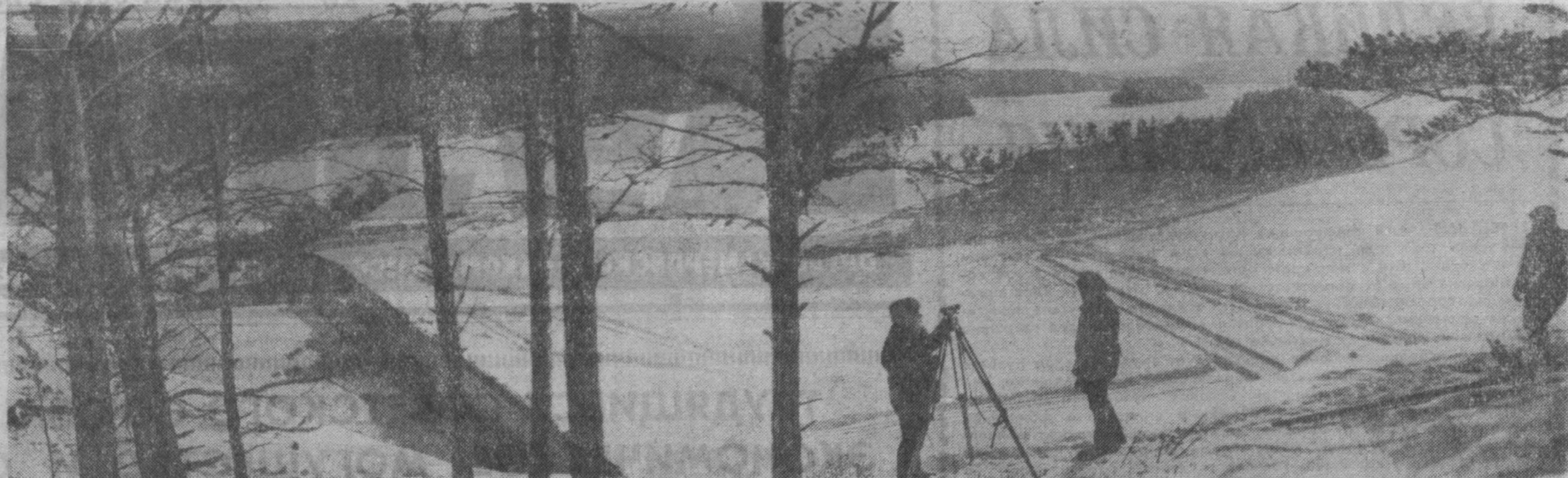
НА СТРОИТЕЛЬСТВЕ УСТЬ-ИЛИМСКОЙ ГЭС. Апрель 1967 г.

На этой странице трудящиеся Иркутской области рассказывают о своих делах в юбилейном году