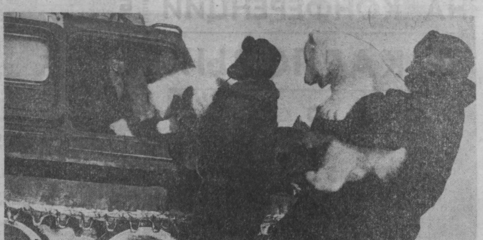
Четыре дня бездежон со зверопазом на борту пробирались по острову. Отсыпая берлоги, он взбирался на скалистые кручи, переползал через расщелины. Первые восемь жилищ зверей оказались пустыми. Медвежата охотничьего острова удалось отыскать берлоги, еще не покинутые обитателями. Охотникам долго пришлось выманить самок из снежных дном. Операция эта связана с риском — разъяренная медведица может разорвать охотников.

не видно. Чистые домики строгими рядами поблескивают синевой дождевой влаги, и кажется, стоит только на миг выгнуть солнце, как все вокруг заиграет серебряными бликами. Хорошо выполнен лист «Улица Красная Новосибирск». По силе цветопередачи холодноватых тонов неба можно с уверенностью сказать, что это изображена улица именно большого сибирского города, а не города, скажем, Украины или Прибалтики. Я дважды побывал на выставке картин Н. Д. Грицюка, и она мне доставила большое эстетическое наслаждение. Думаю еще раз побывать, чтобы до конца понять и осмыслить творчество и манеру акварельной живописи этого своеобразного художника. В. ДУБРОВСКИЙ.