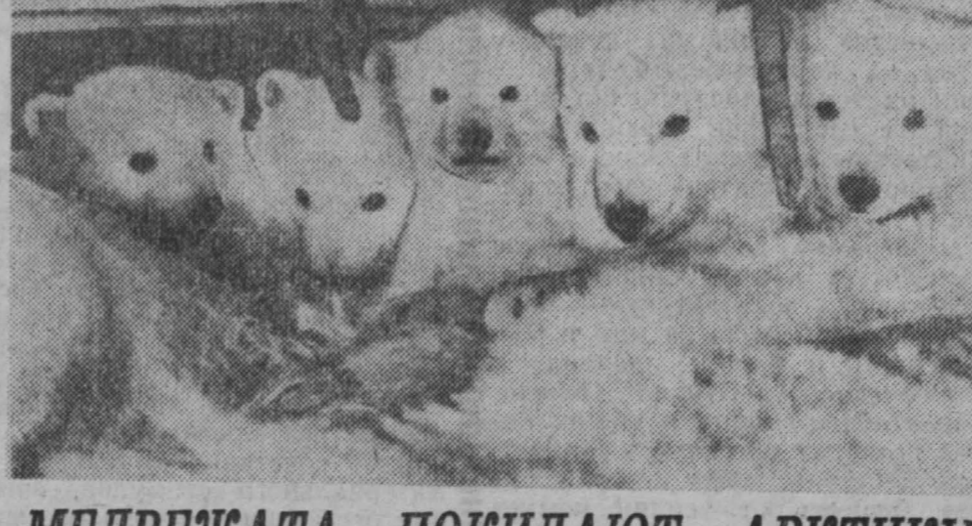
Медвежата покидают Арктику

Четыре дня бездежон со зверопазом на борту пробирались по острову. Отсыпая берлоги, он взбирался на скалистые кручи, переползал через расщелины. Первые восемь жилищ зверей оказались пустыми. Медвежата охотничьего острова удалось отыскать берлоги, еще не покинутые обитателями. Охотникам долго пришлось выманить самок из снежных дном. Операция эта связана с риском — разъяренная медведица может разорвать охотников. Наконец сами отыганы от берлог. Восемь пушистых медвежат изскочили из снежных лабиринтов и водворяются в кабину бездежона. НА СНИМКАХ: Обитателям снежных нор «подан» бездежон. Кабина бездежона — временная «квартира» для медвежат. Действующее путешествие в зоопарк они совершат уже на самолете. Фото Б. Коробейнинова. АПН. 1967 г.