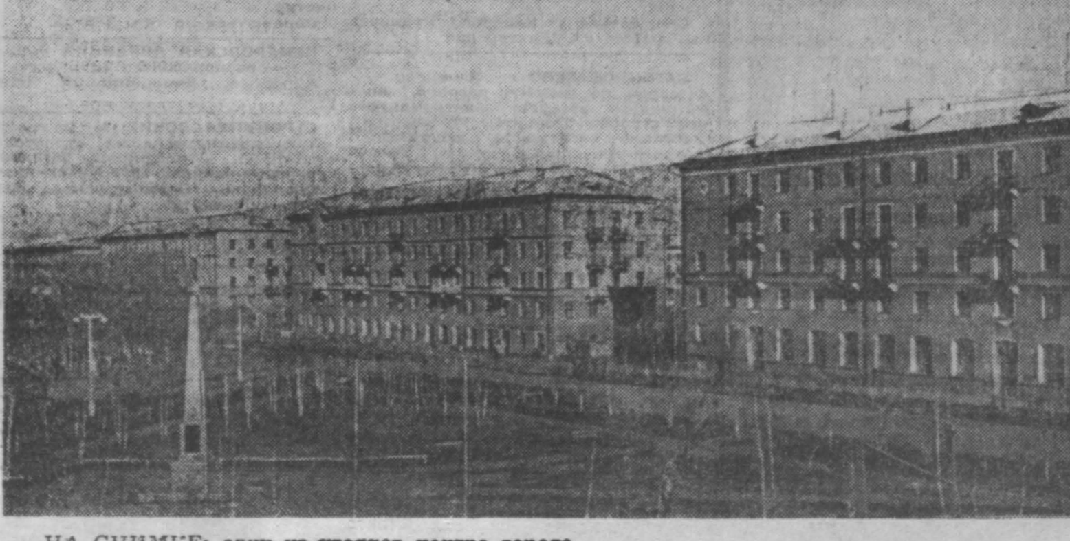
НА СНИМКЕ: один из уголков центра города.