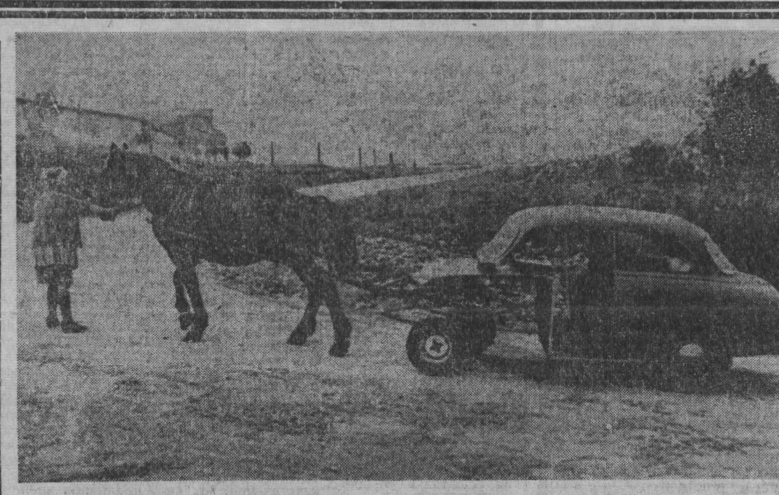
Ф.Р.Г. Фермер, соорудивший эту оригинальную повозку, очень доволен своим новым экипажем. Теперь ему не страшна любая непогода.