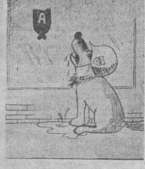
Менты реваншистов. Карикатура из западногерманской газеты «Ди вархайт».

Карикатура из западногерманской газеты «Ди вархайт».