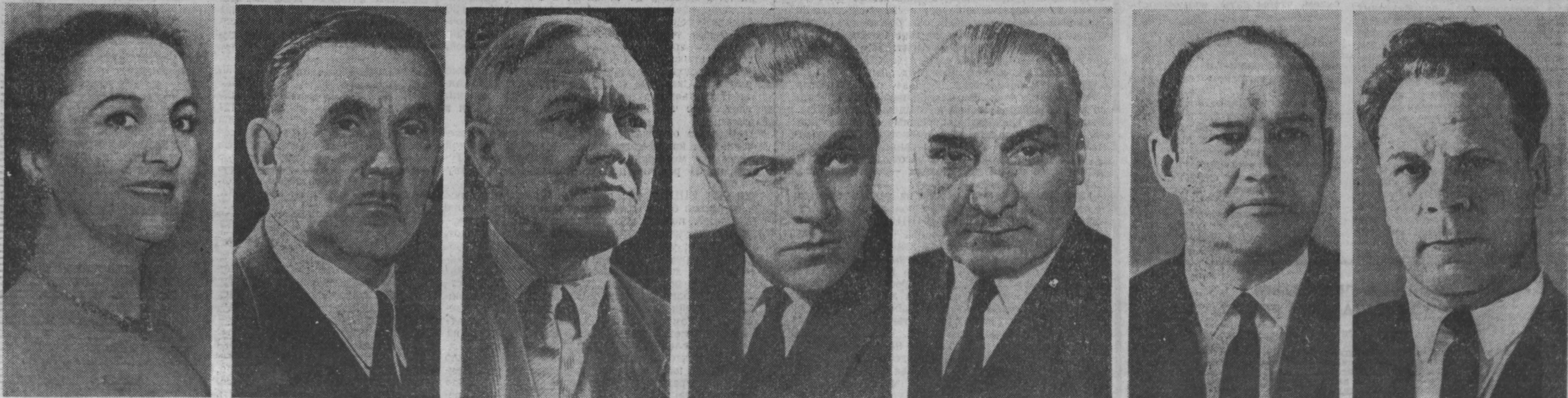
Долуханова З. А.