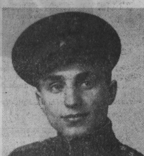
Самый мирный человек — солдат!