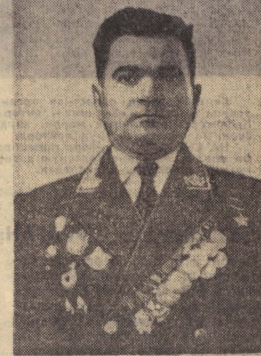
Полк вышел из окружения, хотя и понес большие потери. А гвардейцы уничтожили 68 танков, 8 бронетранспортеров и более 400 гитлеровских солдат и офицеров.

ВАШИНГТОН, 7 января. (ТАСС). Газета «Вашингтон инвинг стар» поместила крупную фотографию, на которой виден охваченный пламенем крестьянский дом в Южном Вьетнаме. На фоне пожара — американские парашютисты. Он поджигает этот дом, участвуя в операции «связанной земли». Соединенные Штаты и их сателлиты осуществляют в Южном Вьетнаме программу уничтожения всех жилищ и урона в районах, население которых, по их мнению, оказывает помощь бойцам-патриотам. Агентство АП сообщает, что в настоящее время американские солдаты выжигают богатый рисовый район к югу от реки Вайно, западнее Сайгона. «Парашютисты из 173-й авиадесантной бригады оборудовали