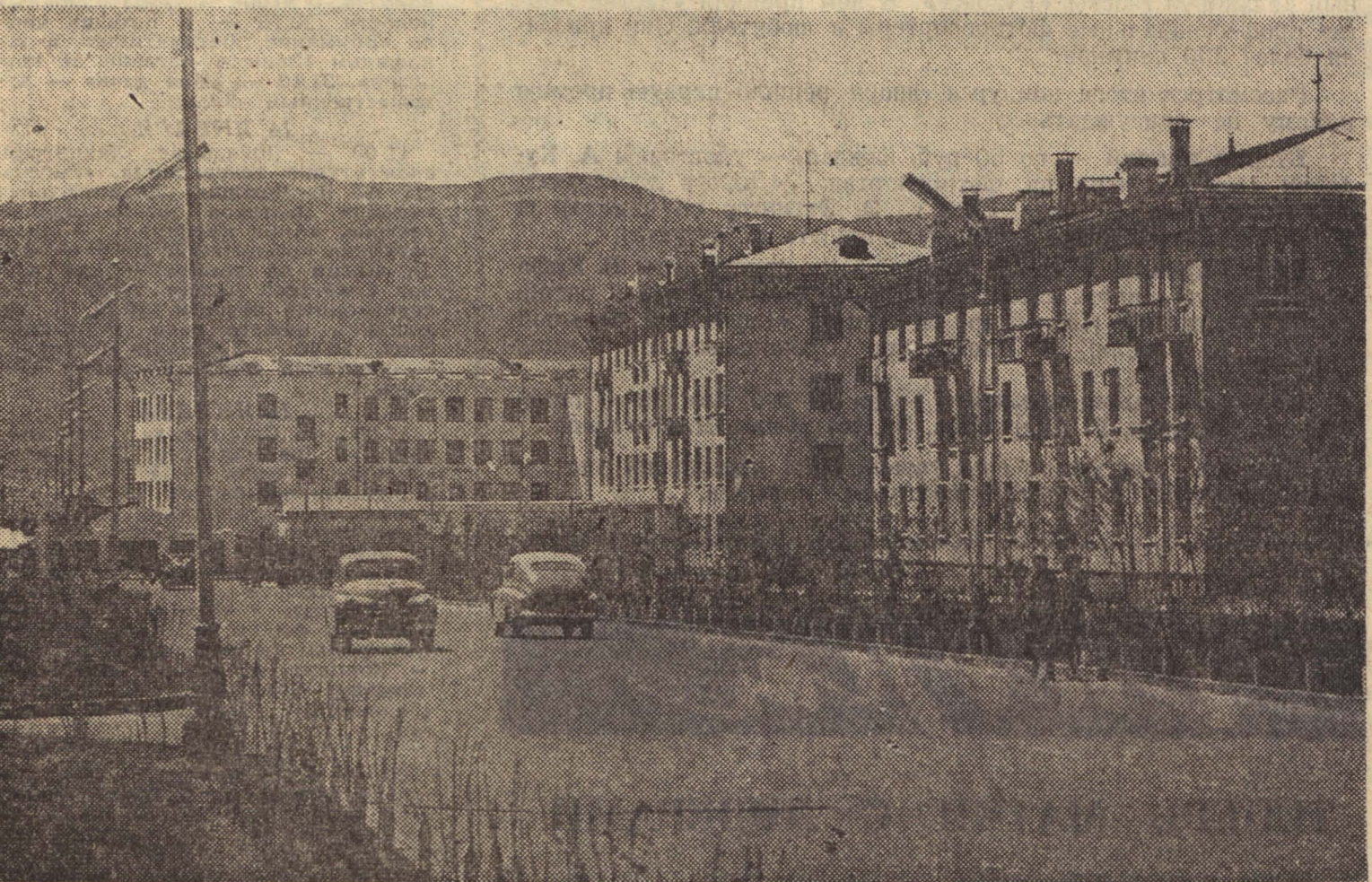
Монгольская Народная Республика. Улан-Батор. Жилые дома для рабочих.

Гаванская печать, уделяющая много внимания Конференции трех континентов, отводит большое место выступлению главы советской делегации на вчерашнем утреннем пленарном заседании. Газета «Трибуна» публикует сегодня в первом выпуске изложение этого выступления на первой полосе, цитируя слова советского представителя о том, что трибуна конференции должна быть трибуной единства, а не раскола.