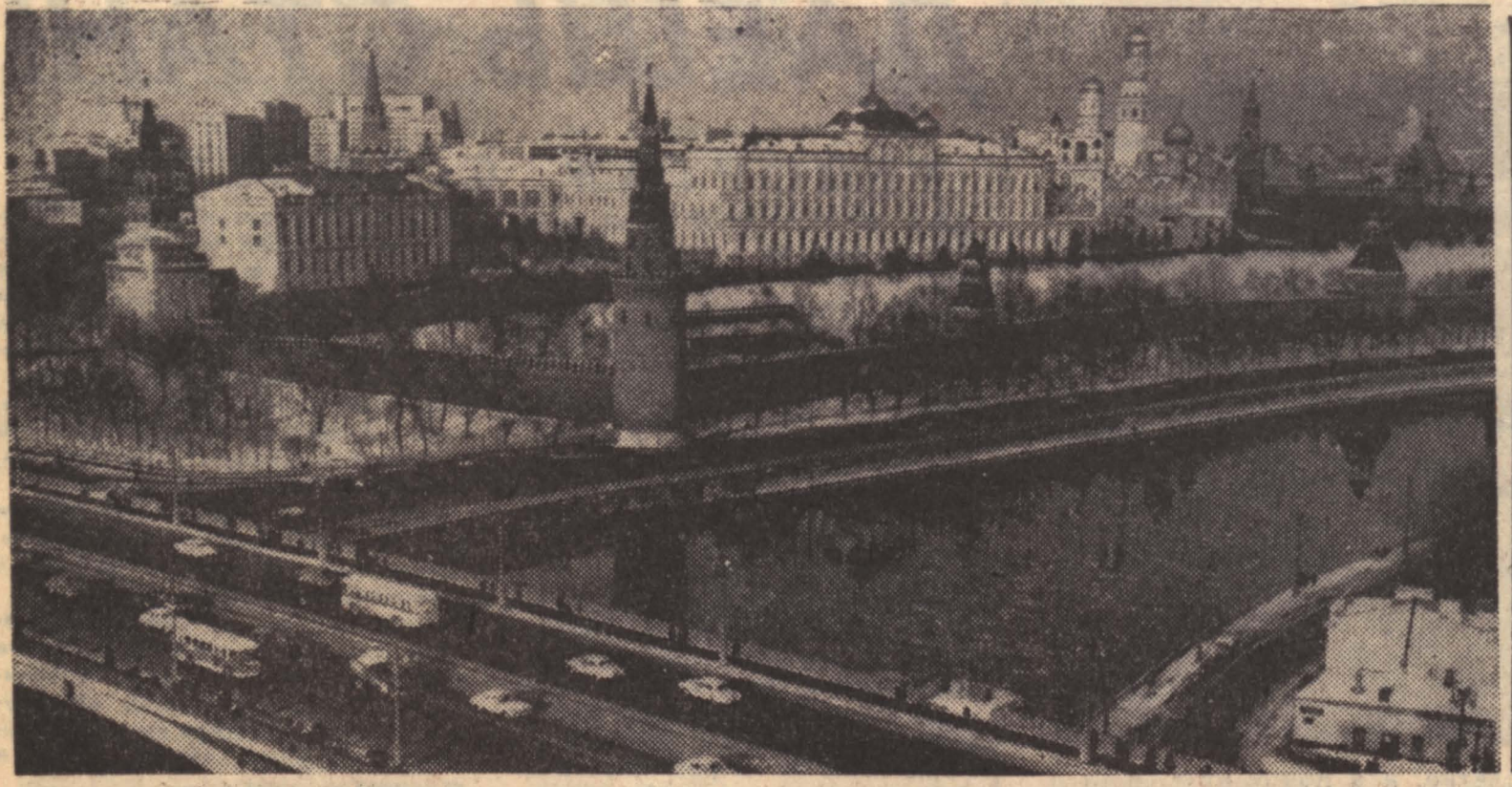
МОСКВА. КРЕМЛЬ.