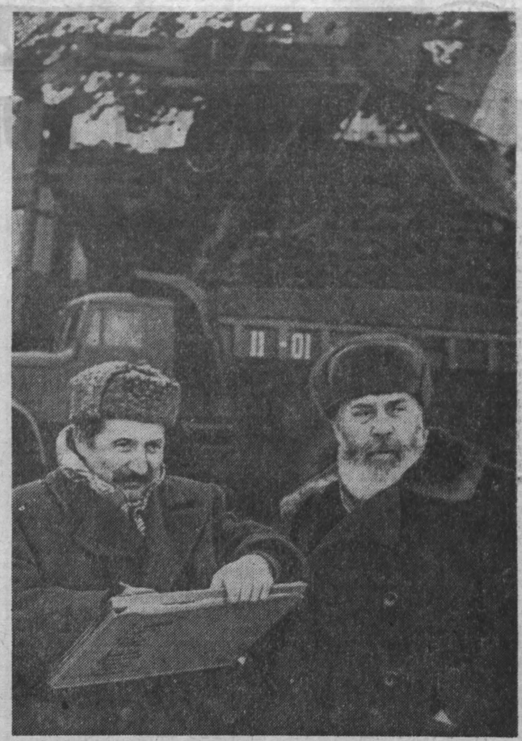
В субботу Кедровский разрез посетила группа художников, которая прибыла на фестиваль белорусского искусства в Кузбассе. Гости беседовали с горняками, делали зарисовки. На снимке: заслуженный художник РСФСР В. Рогов и заслуженный Ленинской премии народный художник СССР А. Кибальников во время посещения карьера.

Мы, российские композиторы, чрезвычайно рады фестивалю в Кузбассе. Год назад с такой же страстью и искренностью посланцев культуры России принимали делегацию белорусских артистов. Встречи, подобные той и этой, оставляют глубокий след в сердце, они чрезвычайно полезны работникам искусства и духовно обогащают миллионы наших слушателей.