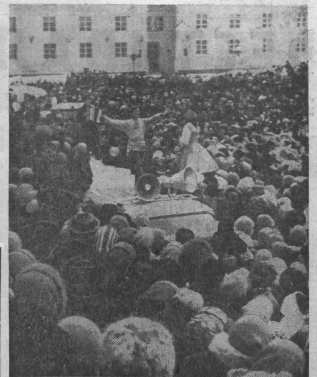
НА СНИМКЕ: проводы зимы. На площади Советов выступает коллектив художественной самодеятельности завода «Карболит».