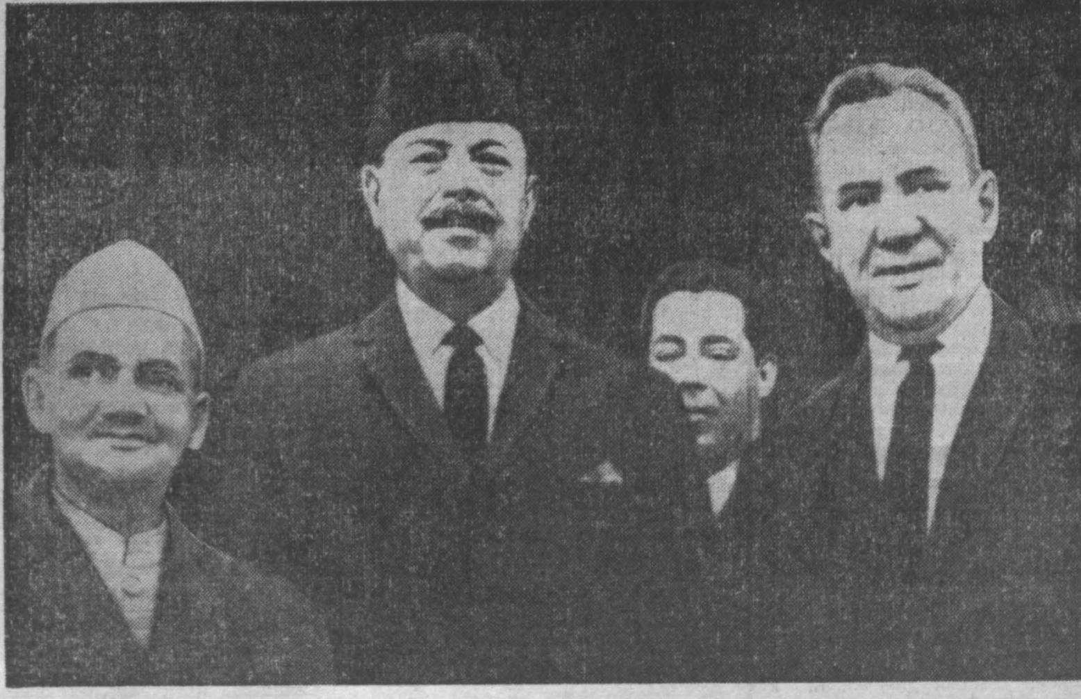
ТАШКЕНТ. Перед началом переговоров. Слева направо — Лал Бахадур Шастри, Мохаммед Айюб Хан, А. Н. Косыгин.

То, что сближает индийский народ и пакистанский народ, отнесется не только к прошлому. Задачи, которые стоят перед ними сегодня, во многом совпадают. Народы обеих стран стремятся решить крупные экономические проблемы, от которых зависит благосостояние их населения и дальнейший прогресс. Нам понятны эти стремления. Мы хотим видеть Пакистан и Индию государствами, живущими в дружбе, решающими мирным путем все возникающие между ними вопросы, успешно выдвигаю-