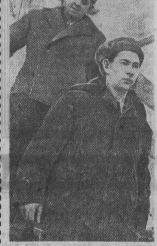
Вестник из Ленинска-Кузнецкого