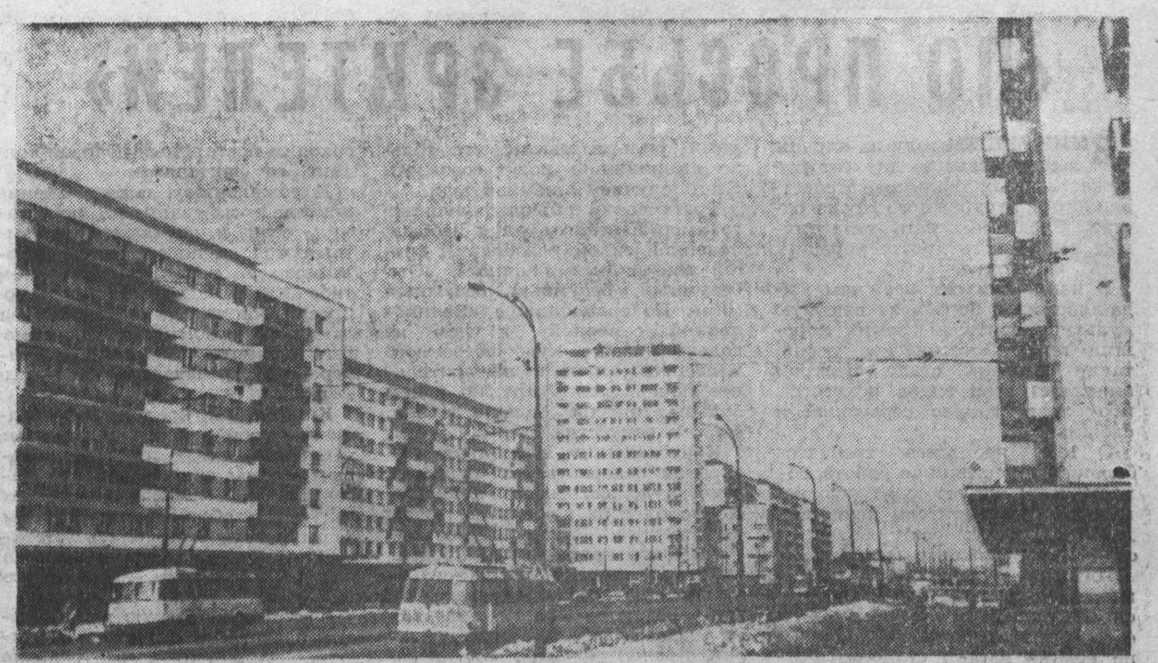
Найдя шестой житель социалистической Румынии отпраздновал новоселье в течение последних 6 лет. За это время в городах и рабочих посёлках построено около 270 тысяч квартир, а в сельских местностях — 40 тысяч домов. Только в Бухаресте в прошлом году в новые благоустроенные квартиры переехало около 13 тысяч семей рабочих и служащих. НА СНИМКЕ: новые дома на магистрали Каля Гринвич в Бухаресте.

— Накажу бракоделов, вышью с них стоимость вещи. И «взыскивает» с октября прошлого года. Заказчице, как на смех, предлагают 13 рублей. Это в десять раз меньше, чем стоит пальто, и в два раза меньше суммы, уплаченной за ремонт. — Хот в суд подавать на бракоделов из этого отдела! — негодует Аверченко. — А чего стоит поведение заведующей! У нее семь пятниц на неделе. Мы являлись лишь несколькими ответами авторам неопубликованных писем. Адресованы они разным читателям, речь в них идет о непохожих случаях, а суть ответов одна — неуважительное отношение и к другим, и к себе. В. МАТВЕЕВ.