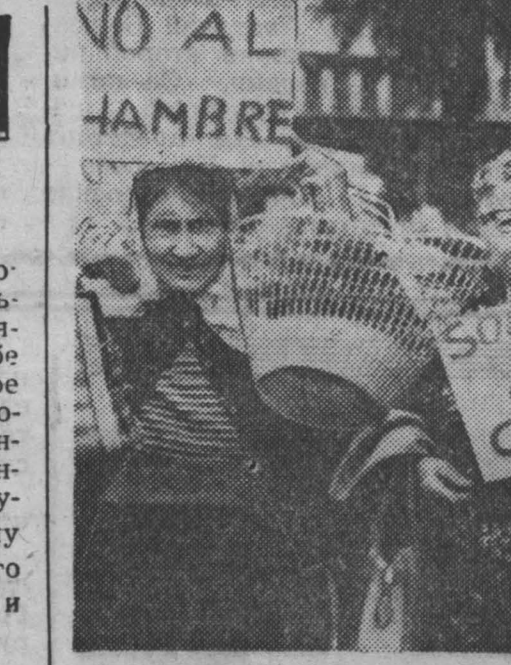
В Уругвае растет дороговизна. Цены на продукты первой необходимости за 1965 год возросли на 60 процентов. Многие трудящиеся находят в отчаянии положение, так как зарплатной платы не хватает даже на питание. В Монтевидео и других больших городах крупные коммерсанты припрятают продукты. Домохозяйки проводят демонстрации «пустых продуктовых сумок».

детей и подростков заставляли беспрестанно читать молитвы, причем они обязаны были при этом стоять на коленях. Чтобы прочесть молитву, их поднимали с кровати по ночам. Любопытно, что в приюте «приличия» и «стыдливость» мальчишки могли купаться только одежками. Простым делом двое детей угодили в тюрьму из-за того, что одержка стеснилась их.