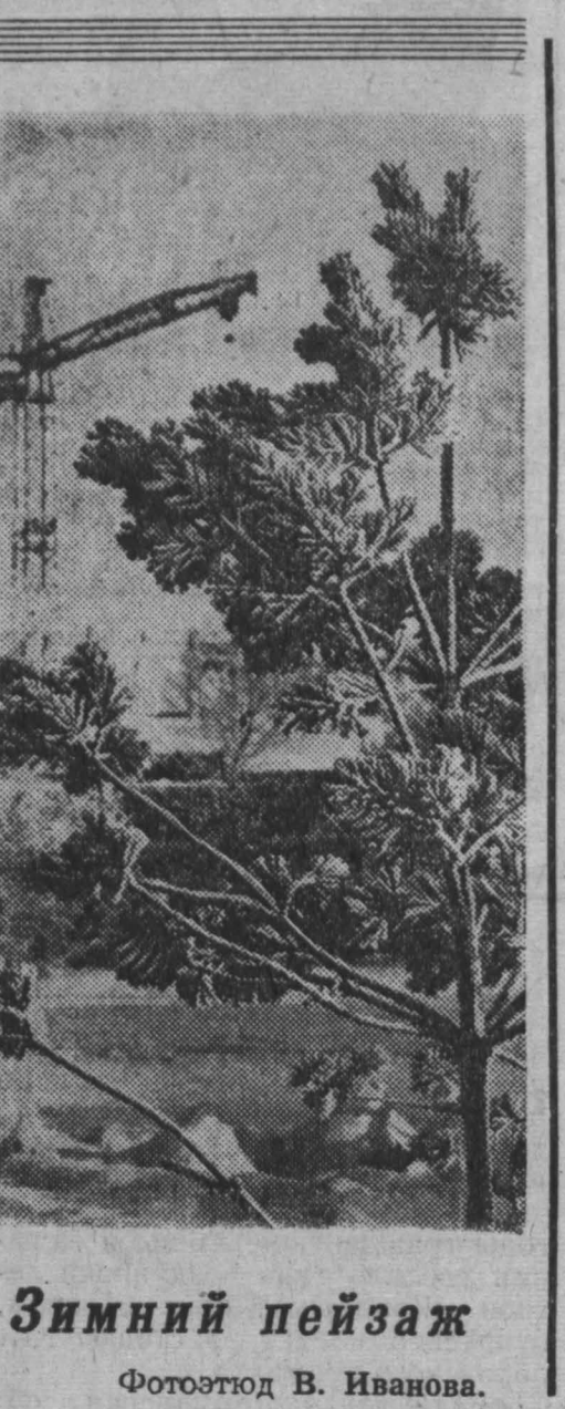
Зимний пейзаж.

Первое мгновение продавица непонимающе смотрела в лицо следователю, а в этот момент, потом до нее дошел смысл сказанных им слов: — Денег, живи! Ну! — мужчина тряхнул пистолетом. Продавица была не в силах сделать ни малейшего движения. Грабитель, вырвавшись, вскинул руку. Раздался выстрел, удесятеренный глухими стенами полуподвального помещения. Женщина упала. ... Разные дела поручались лейтенанту милиции Константинову. Такое серьезное и, казалось, такое безнадежное — впервые. Придя в себя после обморока, продавица попыталась было рассказать о случившемся, но сразу же замолчала. Само главное — примет преступника — она не запомнила. Хорошо лишь отпечаталось в памяти рыжая мохнатая шапка, холодные синие глаза, худощавое молодое лицо. Даже как выглядел пистолет — не могла сказать. Но тем не менее продавица твердо заявила, что опознает преступника, если его ей покажут.