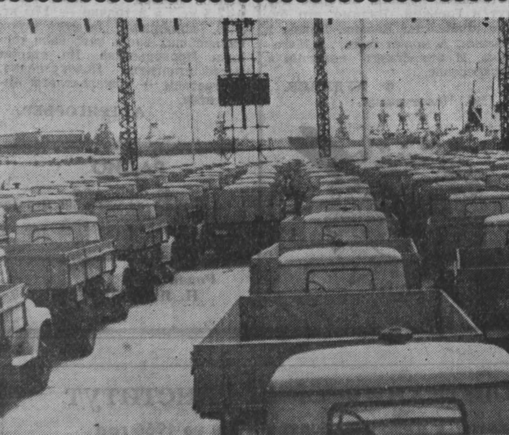
В 50 стран Европы, Азии, Африки и Латинской Америки продает социалистическая Румыния изделия машиностроительной промышленности. В списках экспортных изделий — грузовые автомобили, тракторы, железнодорожные вагоны, оборудование для химической, нефтяной, текстильной и других отраслей промышленности. Крупным заказчиком на румынское оборудование и машины является Советский Союз. НА СНИМКЕ: партии грузовиков в порту Констанца перед отправкой.

детей и подростков заставляли беспрестанно читать молитвы, причем они обязаны были при этом стоять на коленях. Чтобы прочесть молитву, их поднимали с кровати по ночам. Любопытно, что в приюте «приличия» и «стыдливость» мальчишки могли купаться только одежками. Простым делом двое детей угодили в тюрьму из-за того, что одержка стеснилась их.