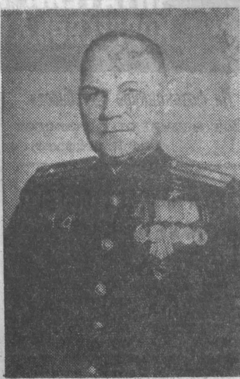
О том, что Герой Советского Союза В. А. Гнедин — юный сибиряк и автор книги «Сквозь пламя», я узнал в Му-

зей истории Ленинграда, собирая материалы о подвигах сибиряков в боях за город Ленин.