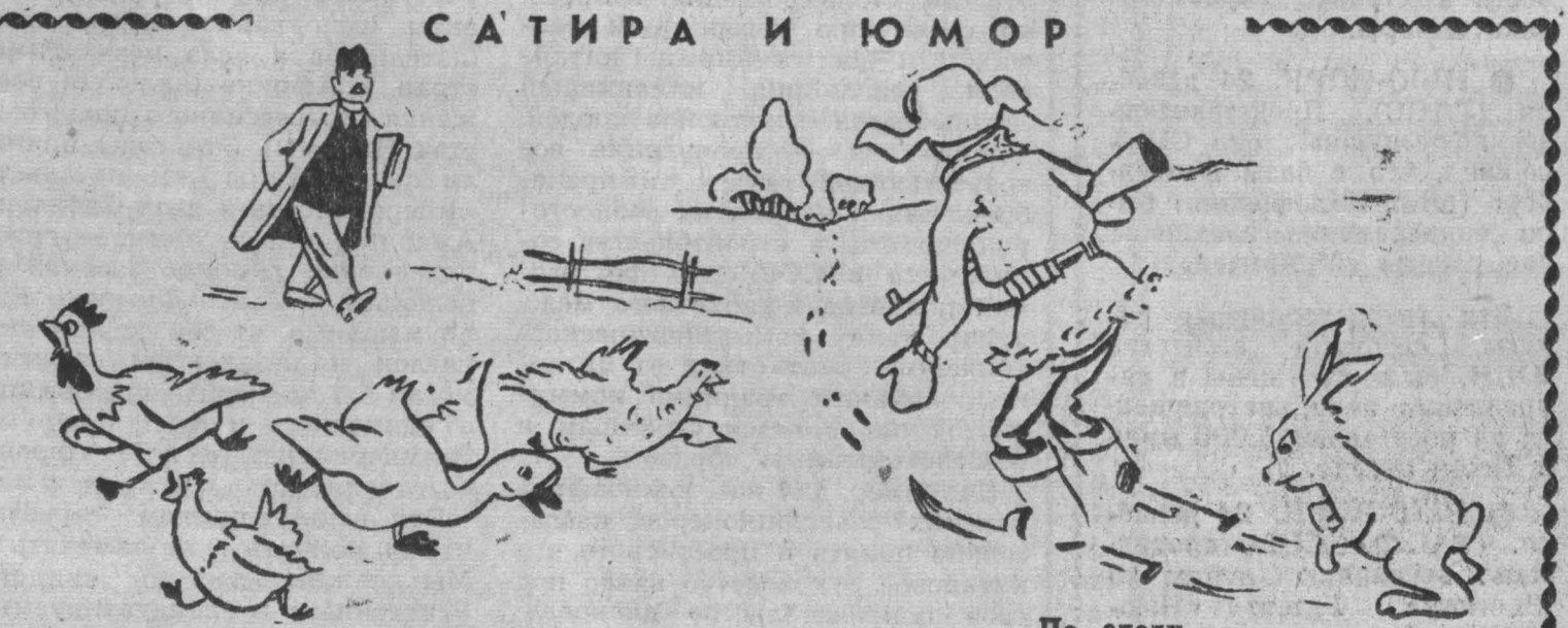
Ревизор пришел... Рис. Е. Смирнова.

В. МАТВЕЕВ. Вотней заботой живя... Фельето Некоторые руководители колхозов и совхозов мало заботятся об улучшении культурно-бытового обслуживания сельских труженников. (Из газет). На целый край гремит колхоз «Гигант», как говорят, богат и знатен. На все лады расхвалил председатель Хозяин Голова! Талант! За что ему такая честь? Гигантские дела в «Гиганте» есть. В коровники заглянешь или в хлев, и в решете даже бани нет! На целый край гремит колхоз «Гигант», как говорят, богат и знатен. На все лады расхвалил председатель Хозяин Голова! Талант! За что ему такая честь? Гигантские дела в «Гиганте» есть. В коровники заглянешь или в хлев, и в решете даже бани нет!