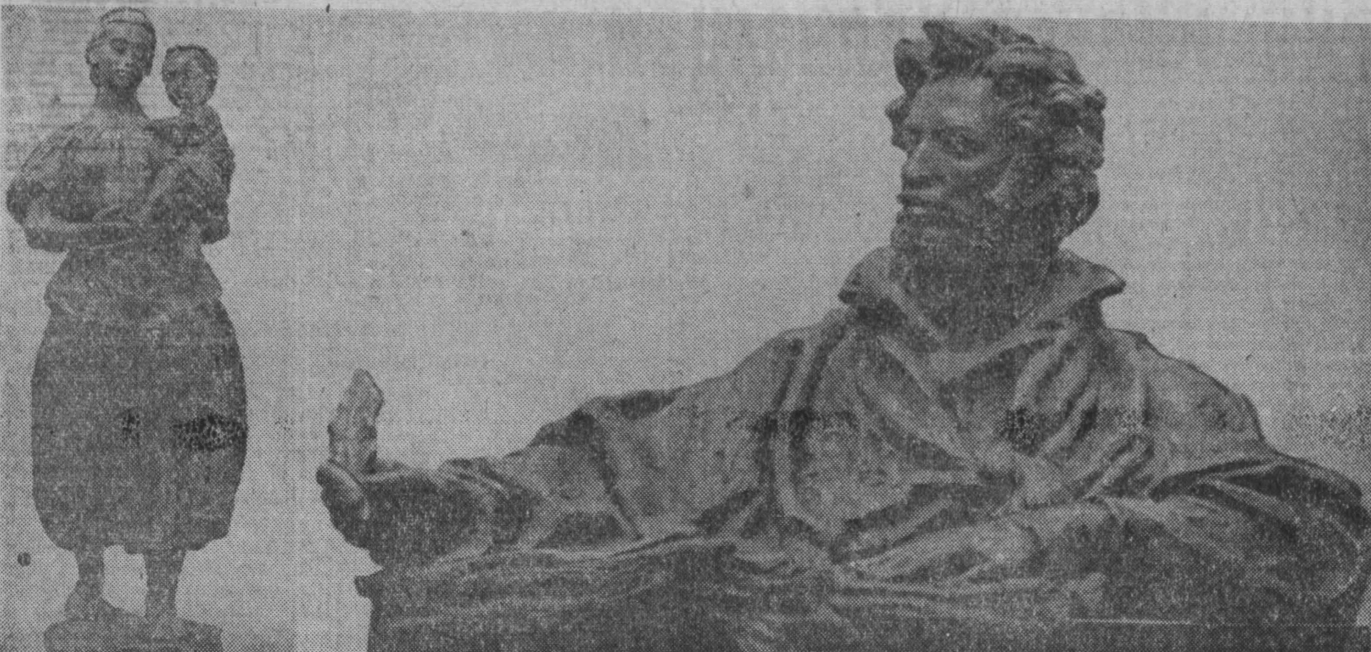
МОСКВА. Лирическое, светлое, ясное восприятие мира характерно для творчества народного художника СССР скульптора Е. Ф. Белашовой, выставка работ которой открылась недавно в залах Академии художеств СССР. Богатство духовного мира советского человека, его чувства и мысли, все доброе, прекрасное, человеческое волнует Е. Ф. Белашову, создающую замечательную галерею женских и детских портретов, образов солдат Великой Отечественной войны, наших современников, а также такие широко известные произведения, как «Непокоренная», «Сон», «Партизан», «Боец», «Мечтатели». Большое место в ее творчестве занимает образ А. С. Пушкина: на протяжении 15 лет скульптор неизменно возвращается к нему, показывая поэта в разные периоды его жизни. За заслуги в развитии советского изобразительного искусства в связи с шестидесятилетием Е. Ф. Белашова награждена орденом Ленина. На этих снимках вы видите две работы Е. Ф. Белашовой — «Утро» и один из портретов А. С. Пушкина.