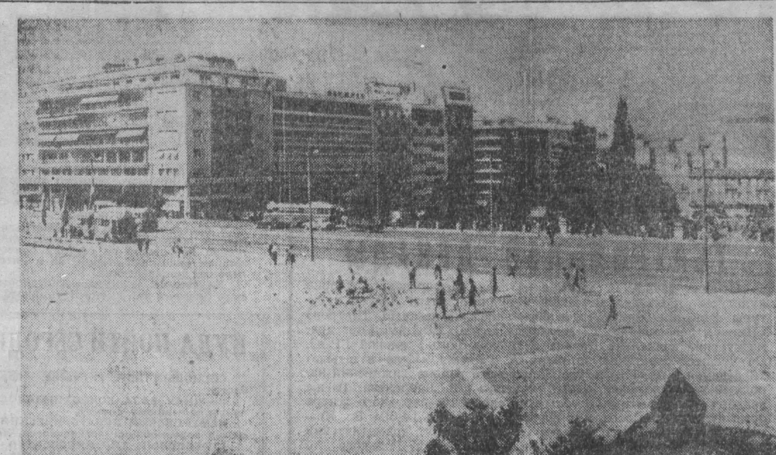
ГРЕЦИЯ. Парламентская площадь в Афинах.

● За первые 20 дней ноября бойцы Армии освобождения Южного Вьетнама в боях с американскими аггрессорами и марионеточными войсками в провинции Тхуауот вывели из строя 542 солдата и офицера противника, включая 336 американских военнослужащих, сообщает Вьетнамское информационное агентство, ссылаясь на сообщение агентства Освобождение. ● Правительство Японии специальным декретом учредило новый национальный праздник — День основания государства. Этот праздник ежегодно будет отмечаться 11 февраля — в день, когда милитаристские правящие круги довели Японию к началу ее империи — «Китансю». ● В Канаде насчитывалось в ноябре около 240 тысяч безработных, что составляет 3,2 процента общей численности рабочей силы. Число безработных увеличилось в течение ноября более чем на 40 тысяч человек. ● Национальное управление по аэронавтике и исследованию космического пространства передало для печати новый список невизитов страны Луны, показывающий большое число кратеров, сообщает Вашингтонский корреспондент агентства АП. Список Луны, сделанный с высоты 900 миль над ее поверхностью, занимает участок площадью 580 тысяч квадратных миль на ее невидимой стороне. ● Генеральный секретарь ООН У Тан в опубликованном докладе Совету Безопасности рекомендовал продлить срок пребывания войск ООН по поддержанию мира на Кипре еще на полгода — до 26 июня 1967 года.