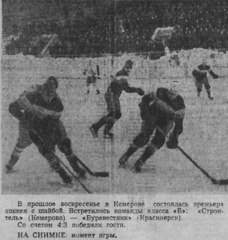
В прошлое воскресенье в Кемерове состоялась премьера хоккея с шайбой. Встретились команды класса «Б»: «Строитель» (Кемерово) — «Буревестник» (Красноярск). Со счетом 4:3 победили гости.

«До принятия Конституции СССР 1936 года высшим органом государственной власти в стране и республиках были съезды Советов СССР (республики). ЦИК СССР был верховным органом государственной власти в период между всеобщими выборами Советов, ответственным перед съездами Советов во всей своей деятельности; ЦИК союзной (автономной) республики — высшим законодательным, распорядительным и контролирующим органом государственной власти республики, избираемым съездом Советов соответствующей республики и ответственным перед ним во всей своей деятельности».