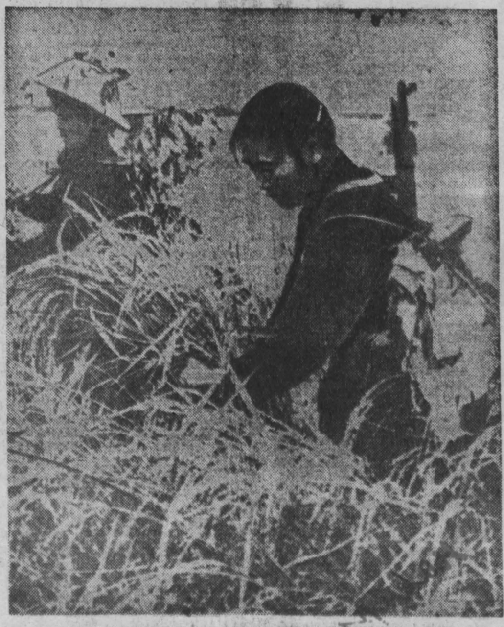
ДЕМОКРАТИЧЕСКАЯ РЕСПУБЛИКА ВЬЕТНАМ. Уборка риса в сельскохозяйственной кооперативе Дай Фонг в провинции Куанбинь. Фото ВИА—ТАСС.

Уборка риса в сельскохозяйственной кооперативе Дай Фонг в провинции Куанбинь. Фото ВИА—ТАСС.