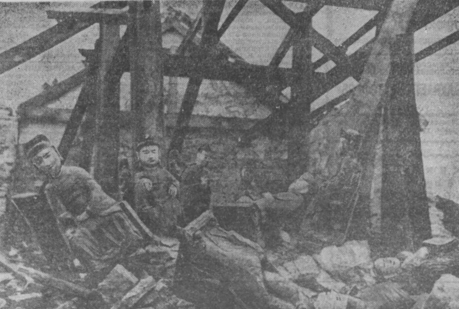
ДРВ. Пагода в городе Намдине, разрушенная американскими воздушными бомбардировками.

Болгарская коммунистическая партия, как и другие братские партии, на деле показывает, что рассматривает себя как неотъемлемую составную часть международного коммунистического движения.