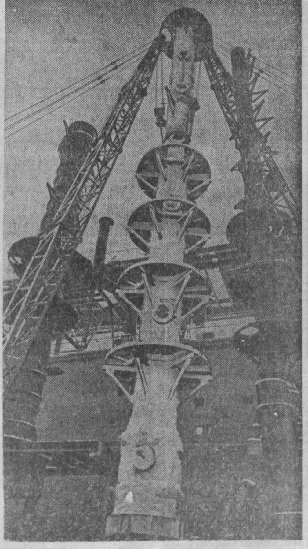
На строительстве комплекса второй очереди капролактама Ново-Кемеровского химкомбината ведется монтаж ректификационных колонн 956-го корпуса. Монтаж ведет бригада КМУ-1 Ивана Федосеева.