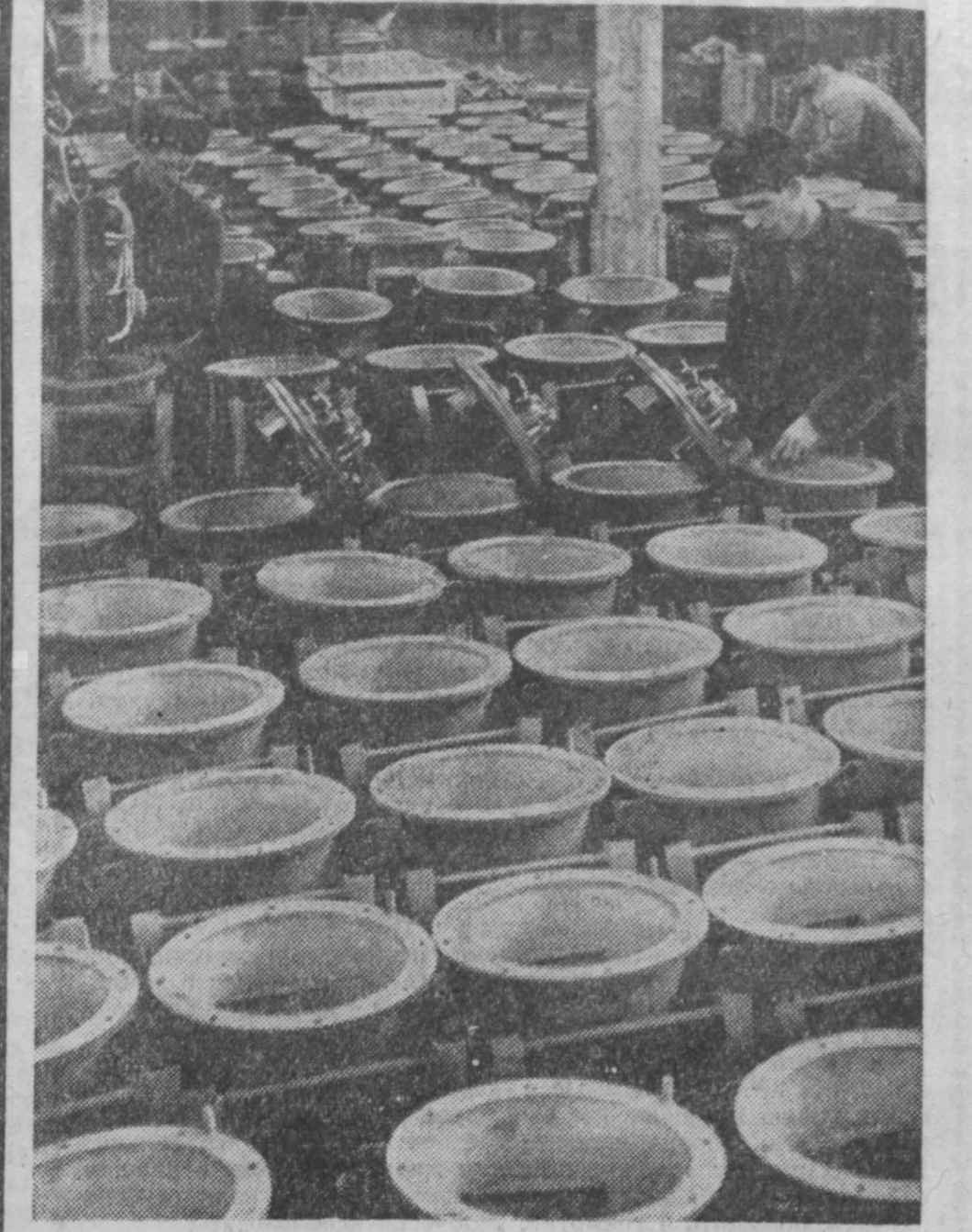
Все большим спросом на предприятиях и шахтах не только области, но и всей страны пользуются изделия, выпускаемые Промкопским заводом шахтных трансформаторов...