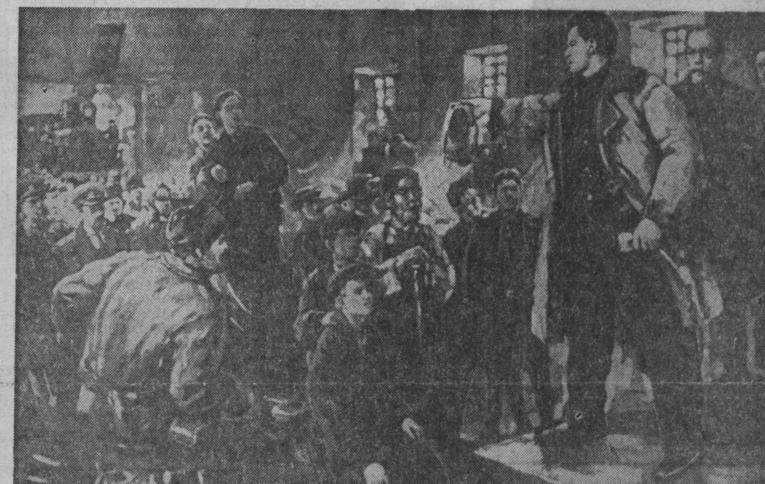
С. М. Киров выступает перед рабочими депо ст. Тайга.

Адрес и фамилия неизвестны. Декабрь 1905 года.