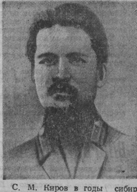
С. М. Киров в годы сибирского подполья.

(Из телеграммы жандармов Тайги томскому губернатору). 1905 год.