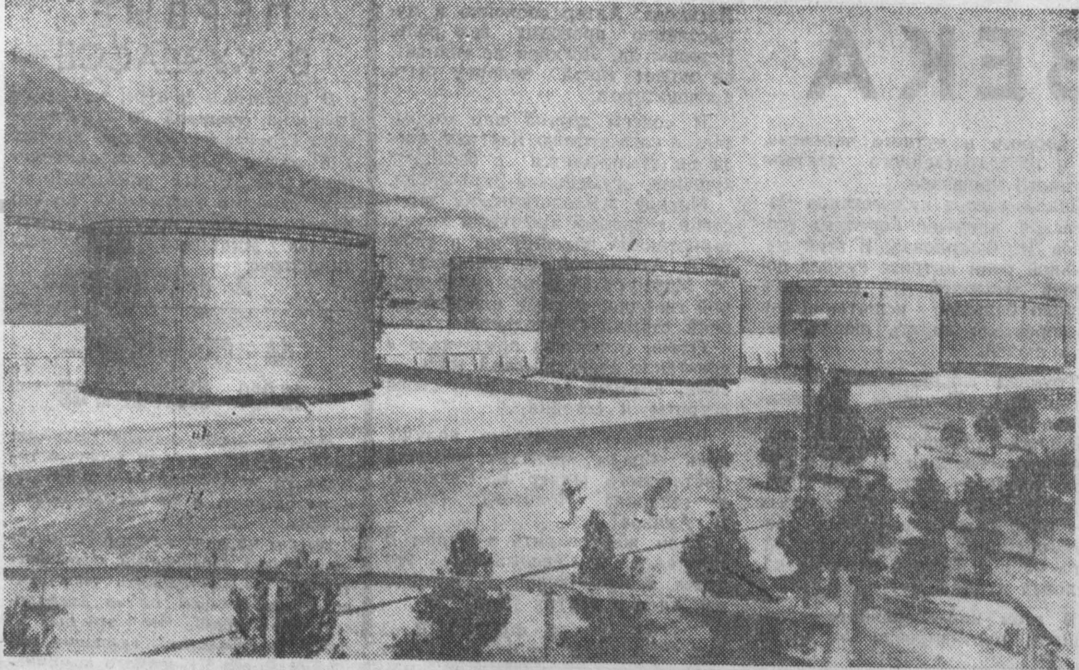
СИРИЯ. Резервуарный парк для горючего общей емкостью 45 тысяч кубических метров...

Вас, милый юноша, — оживленно заговорил он — сама жизнь навела на путь революционной борьбы против господ-любителей рабства.