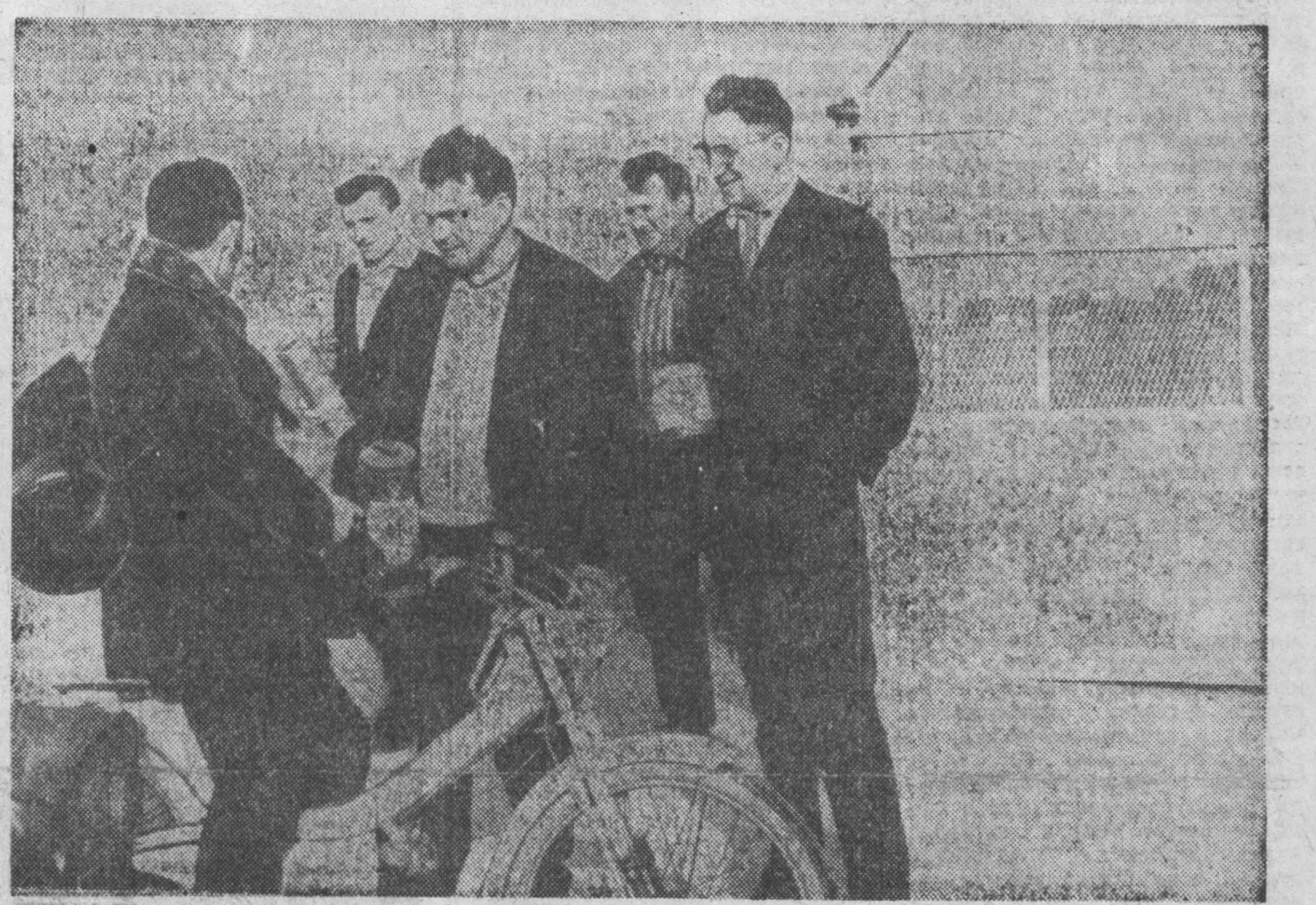
Трудящиеся Франции на стороне героического вьетнамского народа. По инициативе Французского общества народной помощи на предприятиях и шахтах департамента Па-де-Кале проводится сбор денежных средств (на снимке — в городе Бетюн). В итоге андией солидарности, проводившейся ранее, брошено в Вьетнам было направлено четыре санитарные машины.