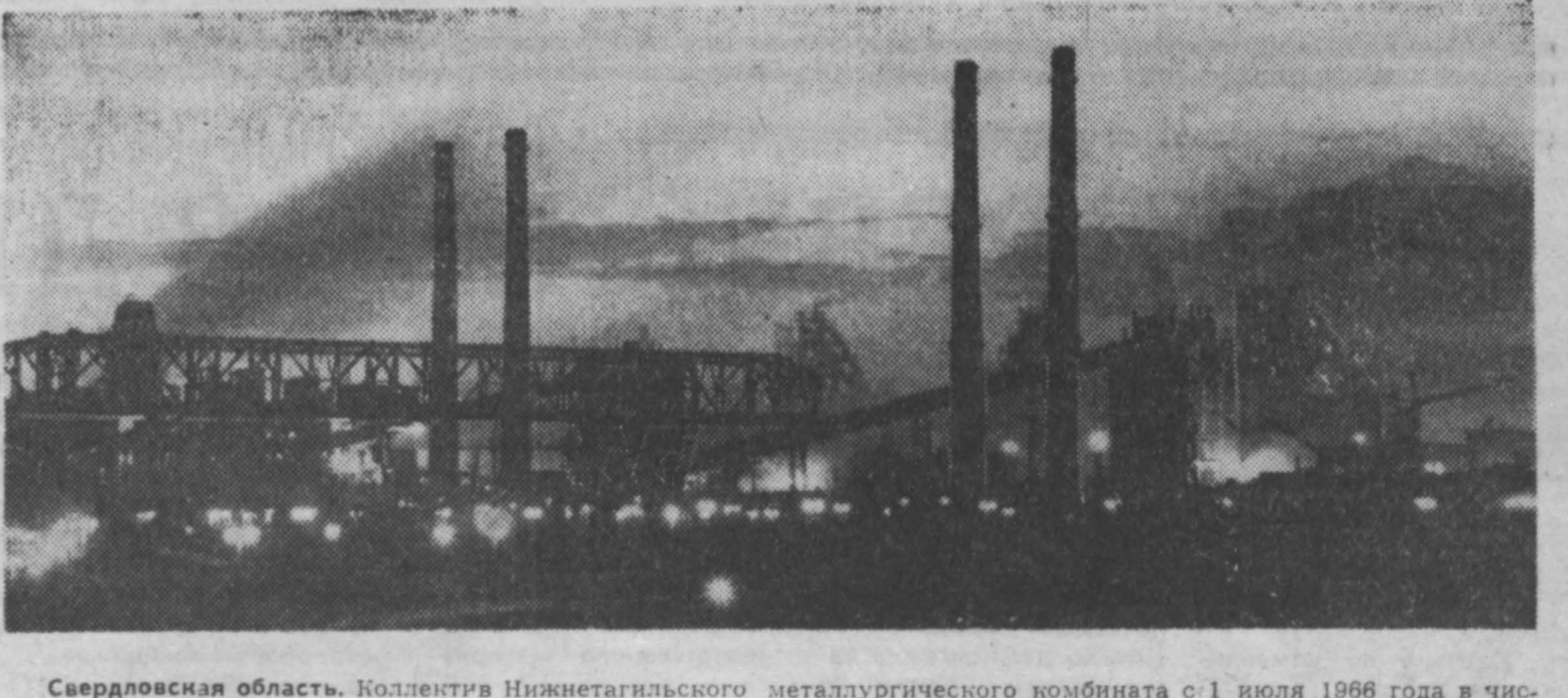
Свердловская область. Коллектив Нижнетагильского металлургического комбината с 1 июля 1966 года в числе первых среди крупнейших металлургических предприятий страны перешел на новую систему планирования и экономического стимулирования. Этому предшествовала большая подготовительная работа. Хозяйственники, инженеры, техники, рабочие и служащие освоили и привели в действие дополнительные резервы производства, тщательно взвесили, что коллектив даст стране и что получит сам, достигнув намеченных рубежей. За счет использования внутренних резервов в цехах увеличен выпуск продукции. За первое полугодие выданы премии, получено сверхплановой прибыли 1.413 тысяч рублей. Мощным стимулом повышения трудовой активности металлургов является социалистическое соревнование. В нем участвуют десятки тысяч рабочих комбината. Организовано соревнование за снижение затрат, за повышение качества продукции. Открыты личные счеты экономии бригад, отдельных работников. НА СНИМКЕ: Нижнетагильский металлургический комбинат имени В. И. Ленина.

Вышла в свет первая книга двадцатилетней «Истории Чувашской АССР» (с древнейших времен до наших дней). Авторский коллектив посвятил издание 50-летию Великой Октябрьской социалистической революции. (Корр. ТАСС).