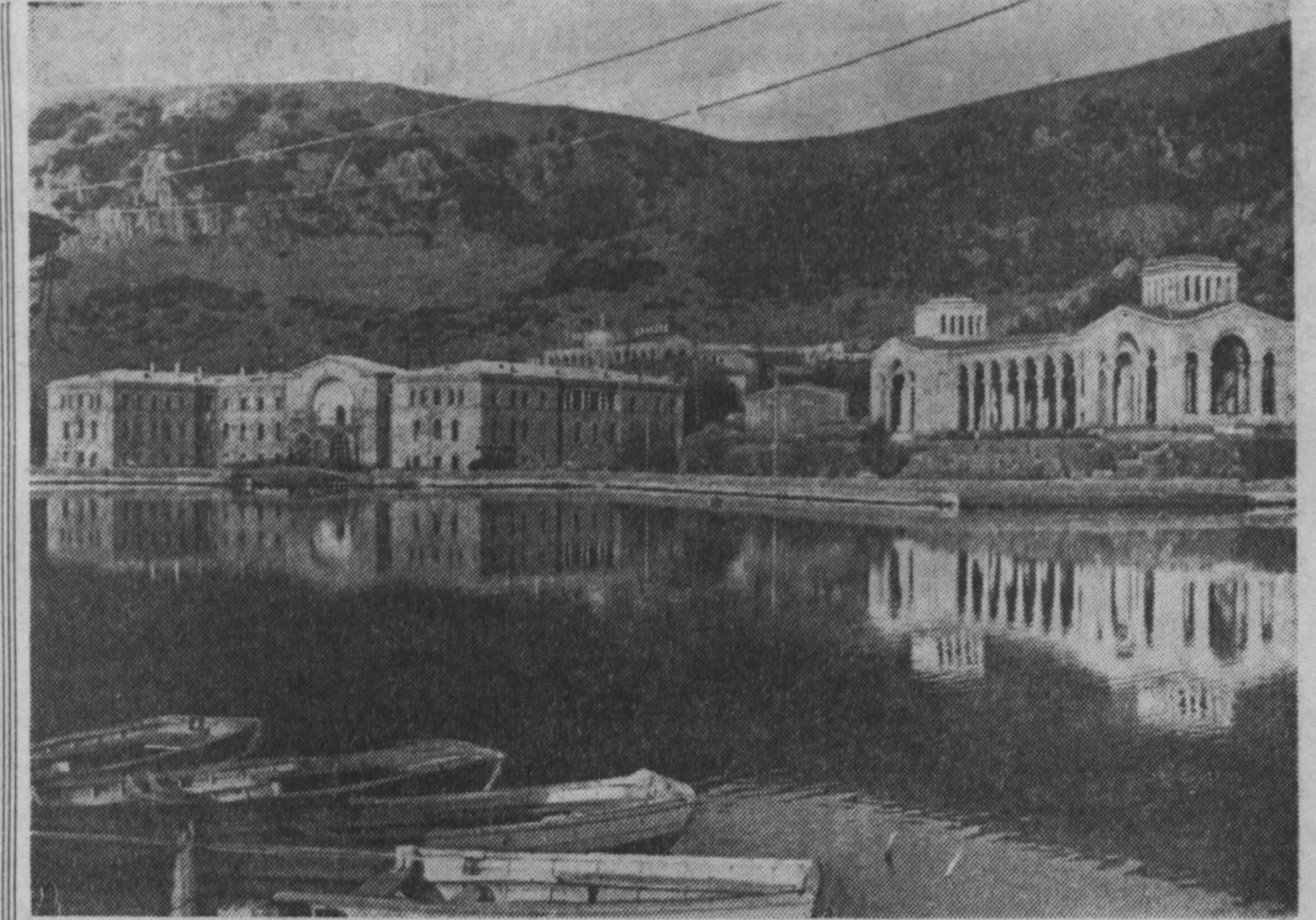
Курорт Джермук, расположенный на высоте 2.000 метров над уровнем моря, славится своим минеральными источниками. Температура целебных вод Джермука достигает 64 градусов.

Много внимания она уделяет работе объединенного ученого совета по историко-филологическим и философским наукам при Сибирском отделении АН СССР, членом которого является.