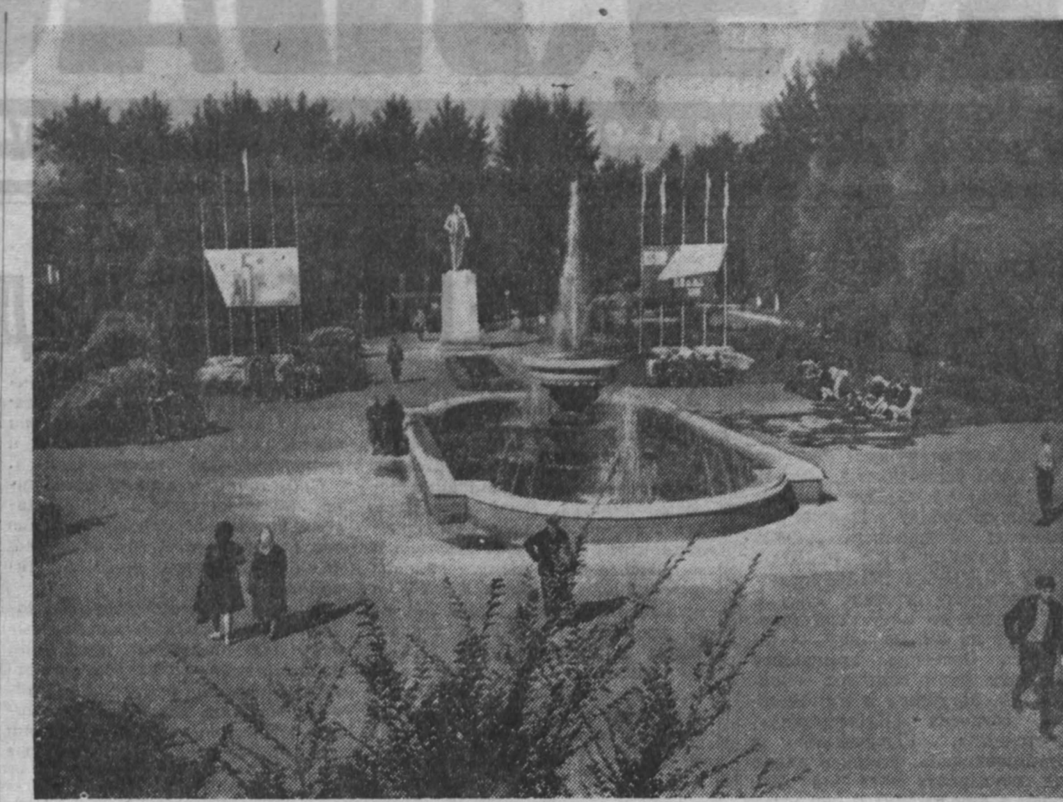
ЗАВОДСКАЯ ПЛОЩАДЬ. В обеденный перерыв здесь всегда многолюдно.

Идет всесоюзный смотр резервов экономики. В комиссии подается все больше и больше предложений, направленных на повышение производительности труда, снижение себестоимости продукции, ликвидацию потерь рабочего времени. Однако главным резервом в коллективе счита-