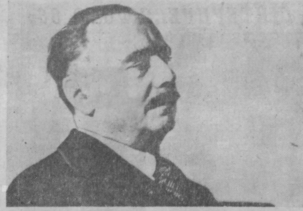
21 сентября исполняется 100 лет со дня рождения выдающегося английского писателя-фантаста Герберта Уэллса (1869—1946), автора романов «Машина времени», «Человек-невидимка», «Борьба миров» и других.