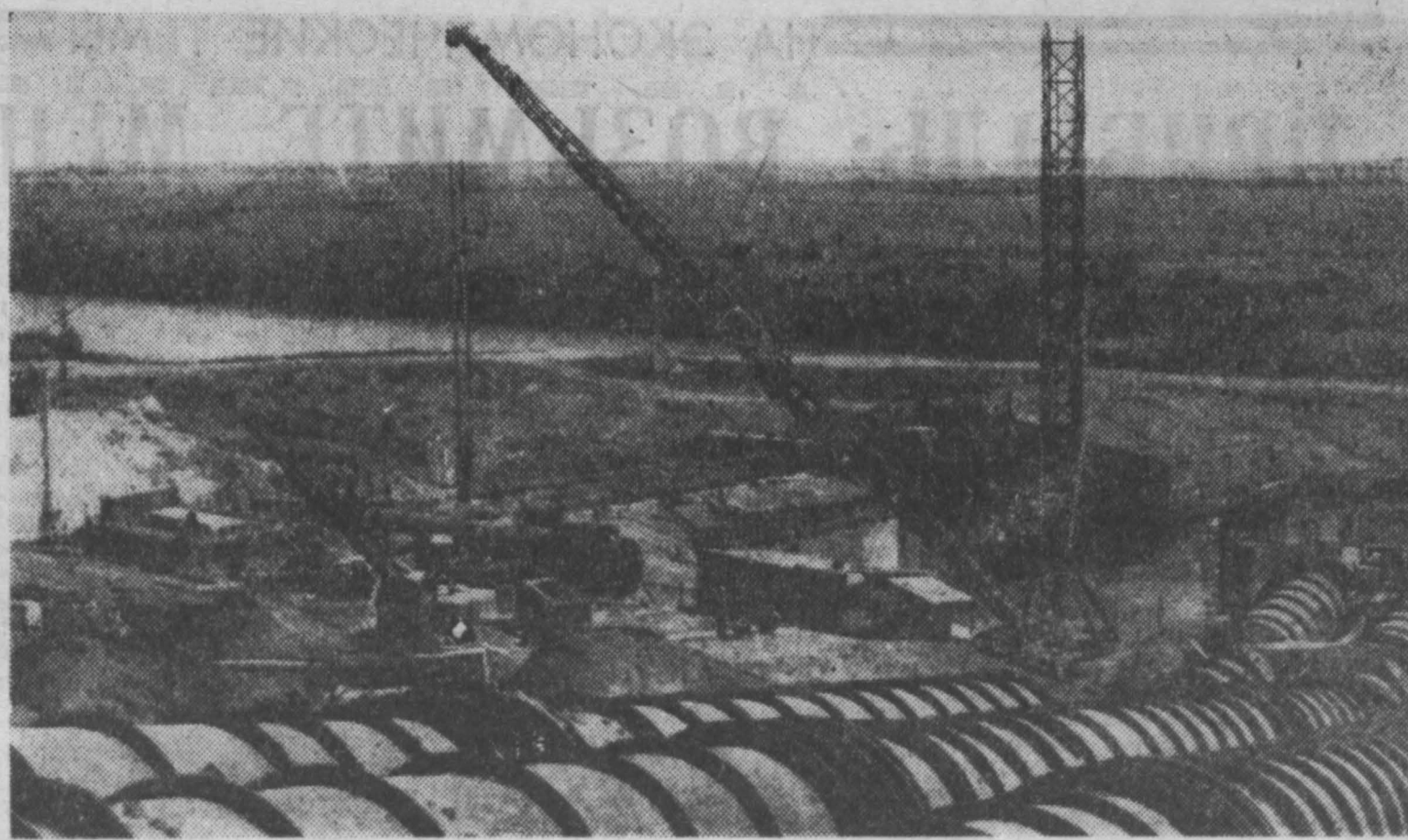
Почти третья часть полноводного Иргыша будет побита на высоту Эйфелевой башни и переброшена на 473 километра в Карганду с помощью девяти двухнасосных станций. Каждая из четырех «ниток» трубопровода сможет пропускать 25 кубометров воды в секунду. Монтаж последней, четвертой, «нитки» завершится на строительстве первой насосной головной сооружения трассы. НА СНИМКЕ: на первой насосной.

Всего в подшефных хозяйствах предприятия района сдали 6 крытых асфальтированных токов, 3 зерносушальни, 7 сушилок, общая производительность которых — 80 тонн зерна в час, два скотных помещения. Я не называю работы по ремонту старых производственных зданий. Они также ведутся. Большую помощь