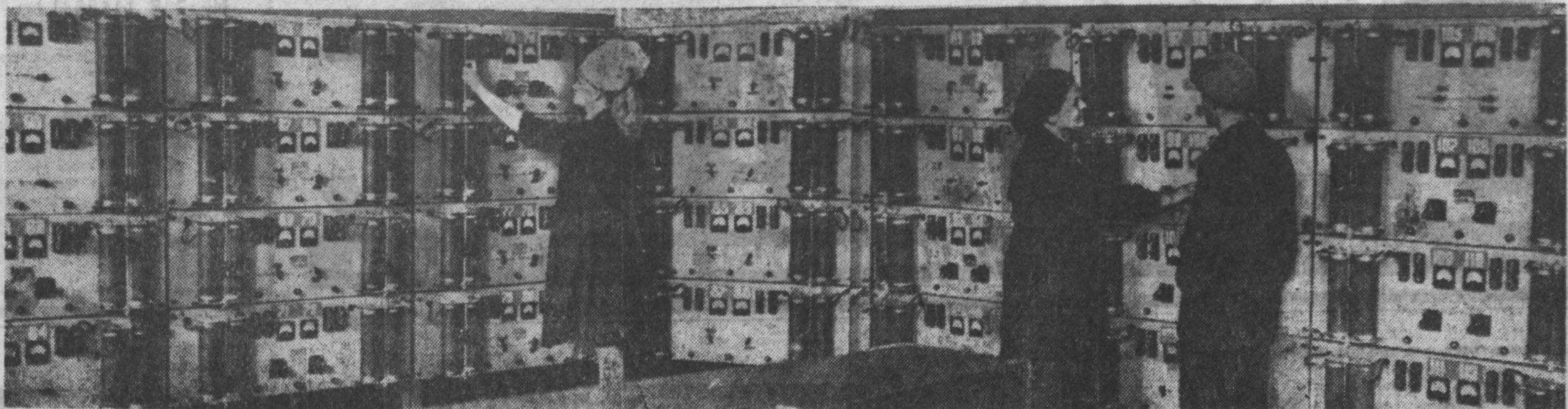
Продукция ленинско-кузнецкого завода «Кузбассалемит» пользуется большим спросом не только у нас в стране, но и за рубежом, особенно шахтные аккумуляторы.

секретарь парткома колхоза им. Ленина, Ленинск-Кузнецкий район.