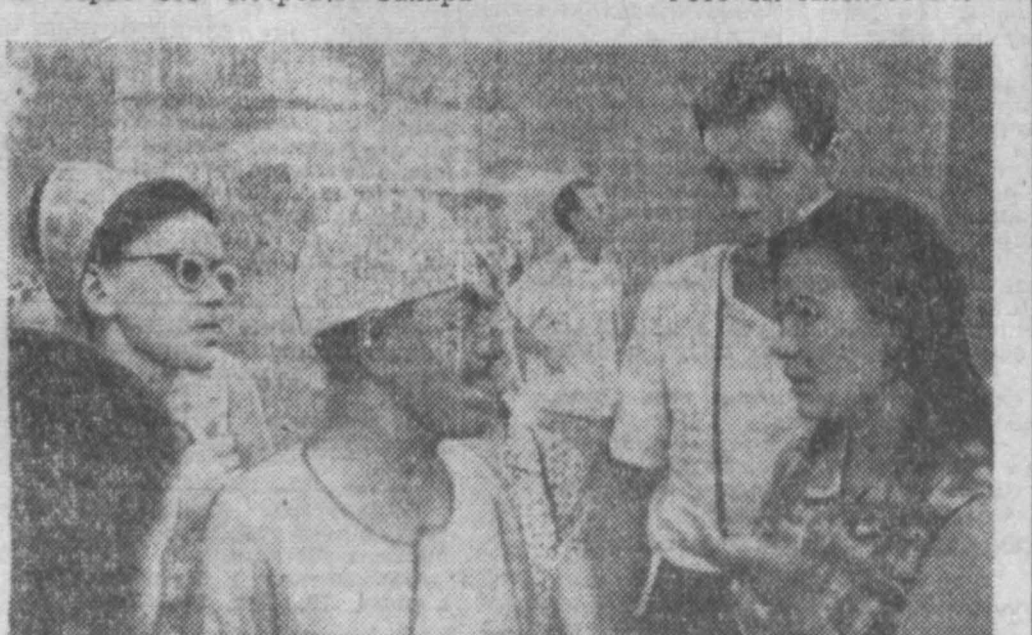
НА СНИМКАХ: Египет, Гиза. Пирамида Хеопса. Гид группы кузбассовцев мистер Абуди.

Автобус мчит по раскаленной Сахаре. Едем по отличной асфальтированной дороге. Вдоль нее столбы со щитами: «Телефон через сто метров» Сахара