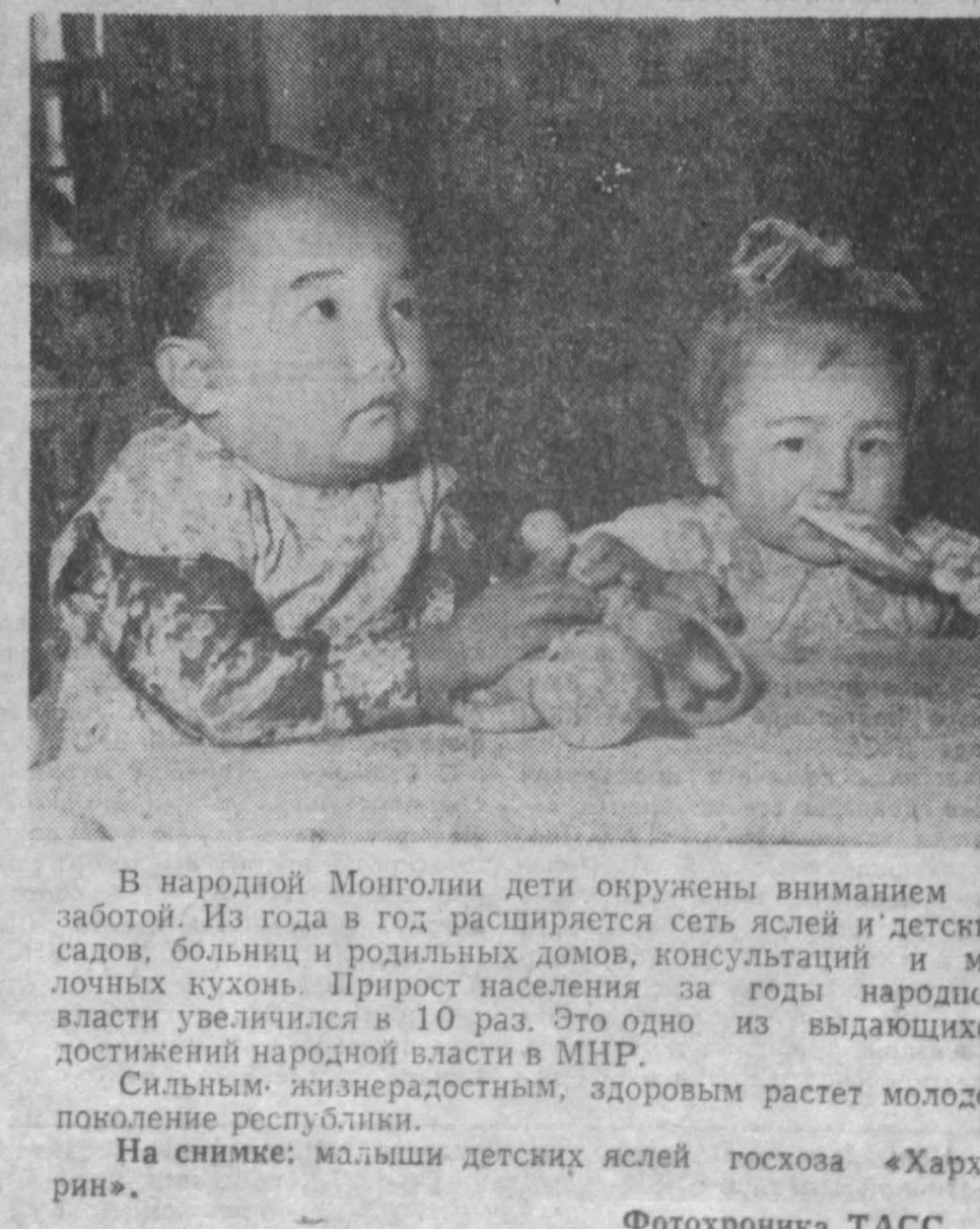
На снимке: мальчик детских яслей госхоза «Хархорин».

Идеологическая борьба с религией не должна ущемлять прав верующих. В ряде решений партии и правительства совершенно ясно указывается на недопустимость здесь административных мер. Если деятельность той или иной религиозной организации протекает в рамках советских законов, она может существовать до тех пор, пока сами верующие не отойдут от нее. Соблюдению законодательства о культах сейчас уделяется много внимания. Требования строго соблюдать законы о культах в равной степени предъявляются как к религиозным организациям, так и к местным органам власти. В начале этого года правительство СССР преобразовало два Совета — Совет по делам русской православной церкви и Совет по делам религиозных культов — в единый Совет по делам религий при Совете Министров СССР. Роль и ответственность Совета в контроле за соблюдением законодательства о культах значительно повысится, и ему предоставлены соответствующие права.