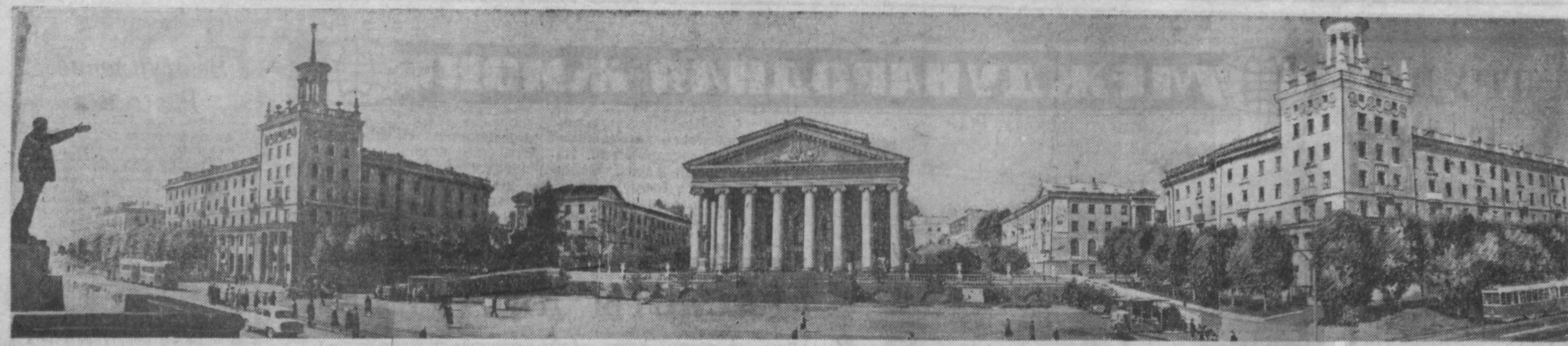
Растет и хорошеет город шахтеров — Прокопьевск. На этом снимке вы видите Театральную площадь.