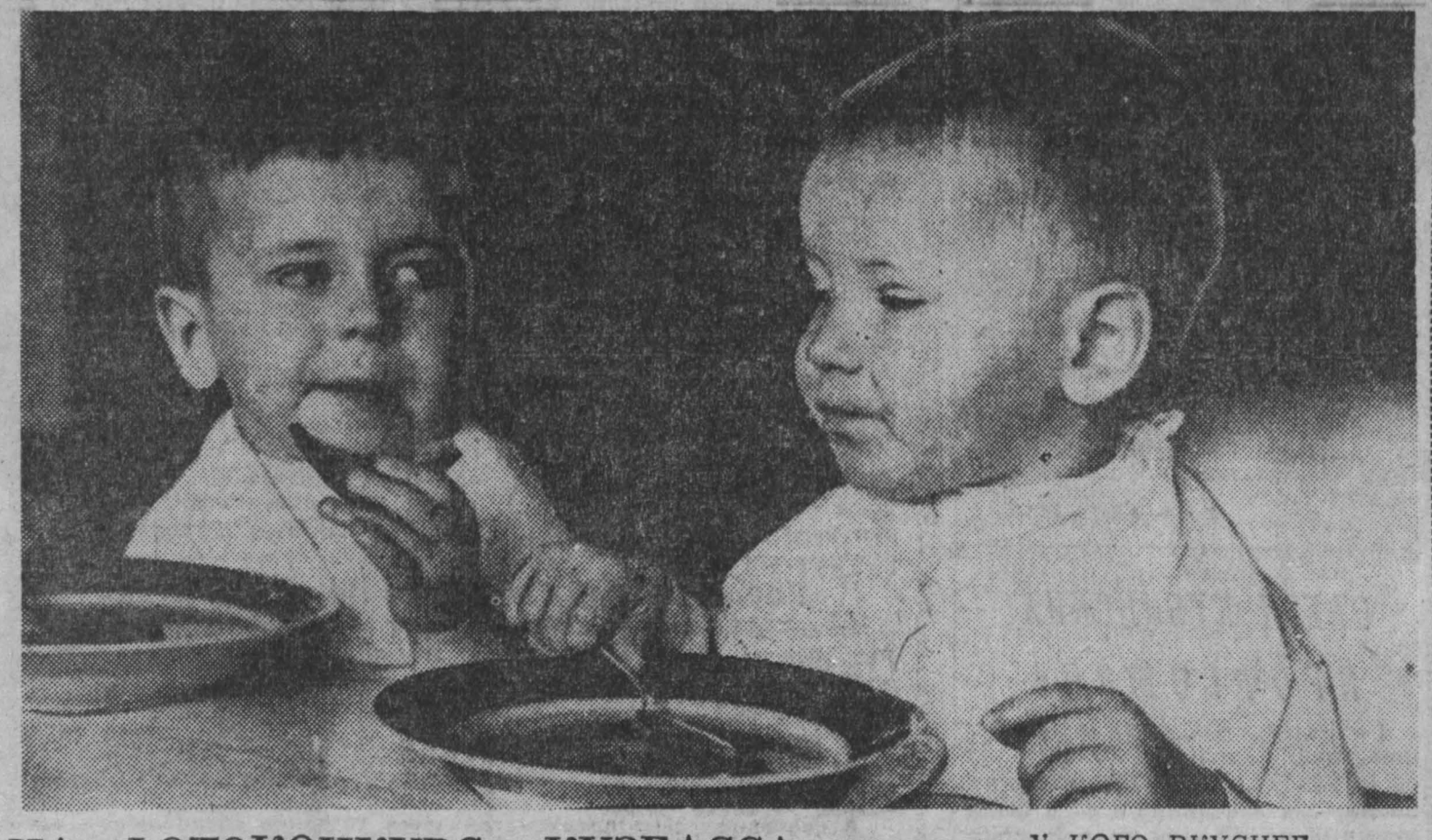
НА ФОТОКОНКУРС «КУЗБАССА» У КОГО ВКУСНЕЕ.

Вот букет «Первокласснику», представленный в экспозиции области Солины № 1. Эршты, чуть не просящий, тон так просится в ручки шаловливого, вешучатого мальчика, да и сам похож на него. А вот название букетов, которые выставили лечебные учреждения Кировского района: «С перенчиком», «В день совершеннолетия», «Пер-