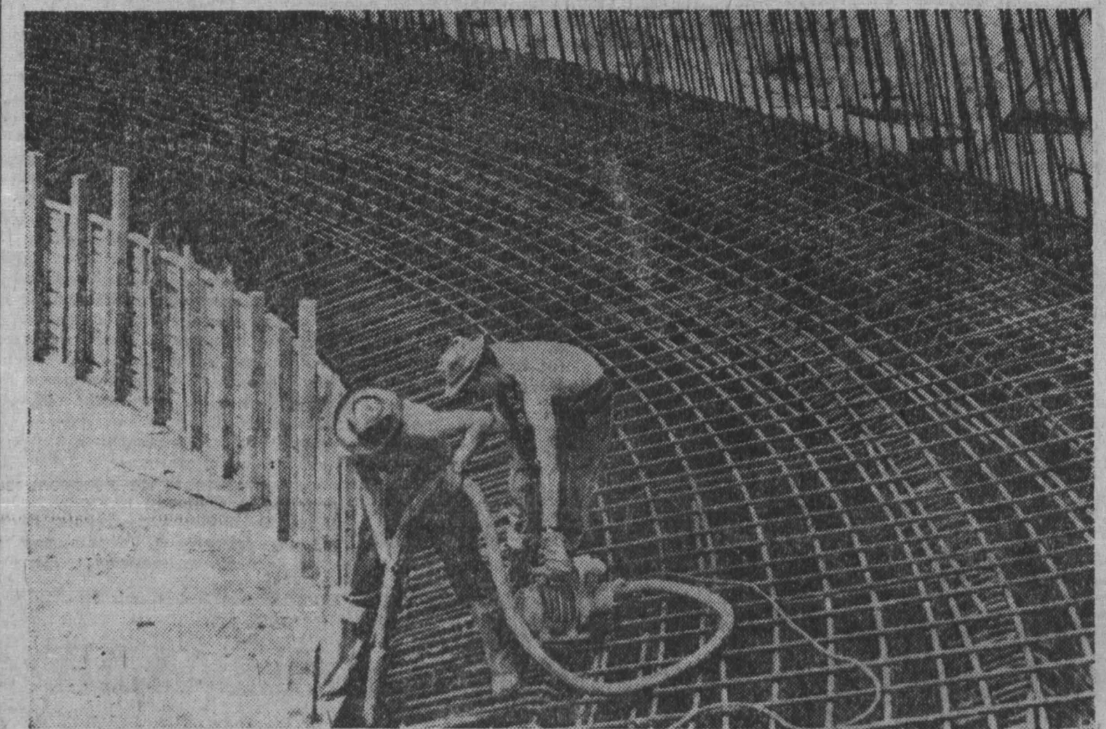
Рабочие уплотняют бетон, заливаемый в основание огромной дымовой трубы.

Вопрос о том, стоит ли надеяться на мальчишек форму, не забываем ли мы, что все-таки это