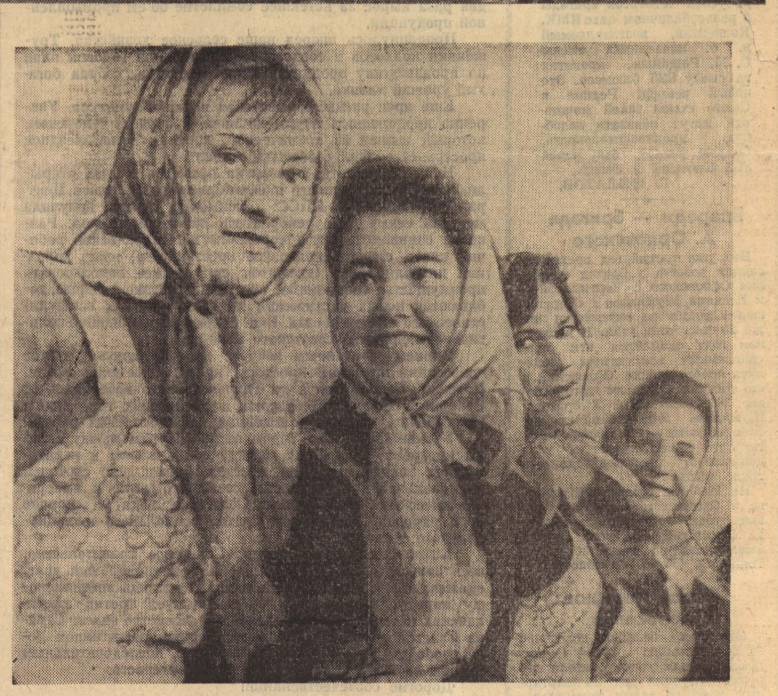
В. МАЛИНИН, спец. корр. «Кузбасс».

Строятся. На заводской корпус похоже здание совхозных мастерских. Возвышается мощная котельная — отсюда идет нитка трубопровода центрального отопления. Им оборудована вся улица новых домов. Зайдем, в любой и внешне замечать, что жить в деревне стали очень... по-городскому. Ванна — пожалуйста, горячая вода идет прямо из крана; праздничную телевизионную про-