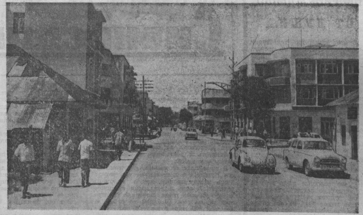
СТОЛИЦА ТАНЗАНИИ ДАР-ЕС-САЛАМ. Улица Свободы.