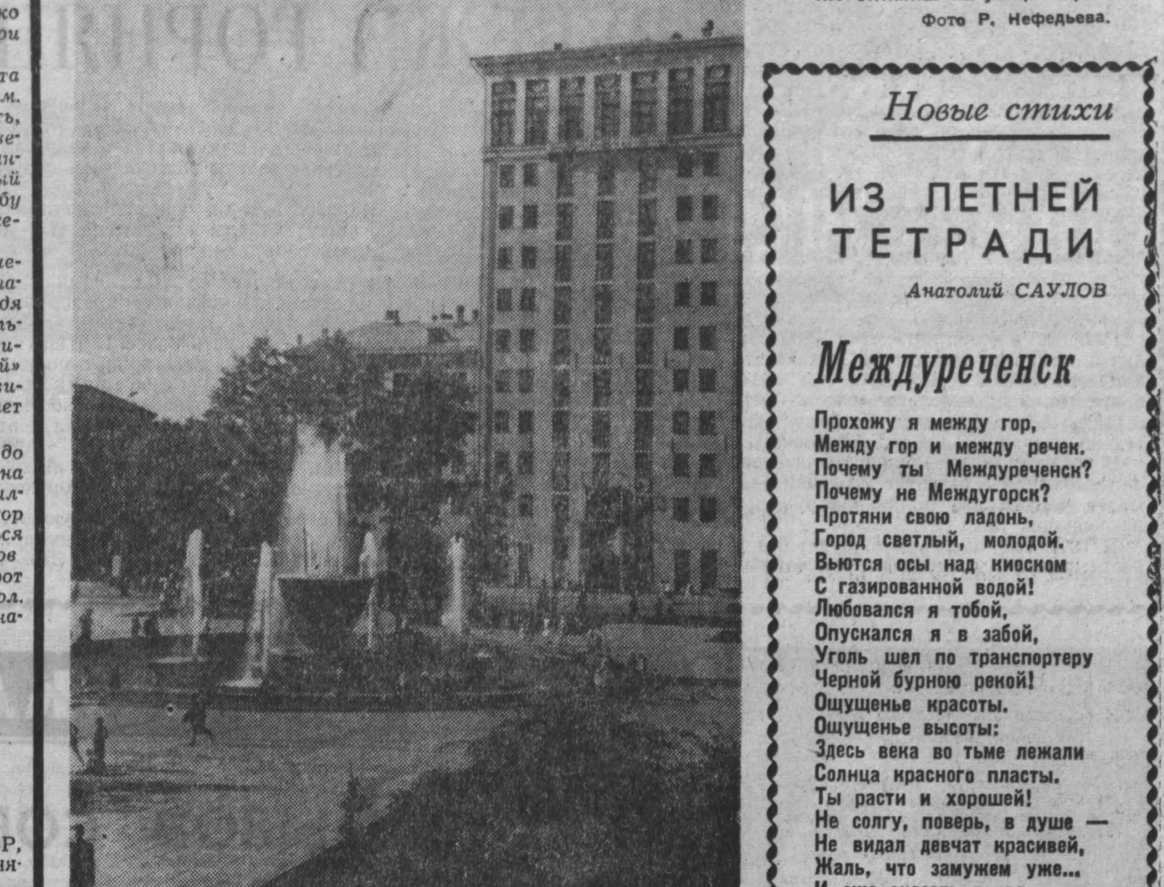
С каждым годом хорошеет город металлургов Новокузнецк. НА СНИМКЕ: на улице Кирова.

Хотелось бы чаще видеть такие встречи. Ведь это было бы хорошим стимулом, приятной памятью для тех, кто делает первые шаги в большой спорт.