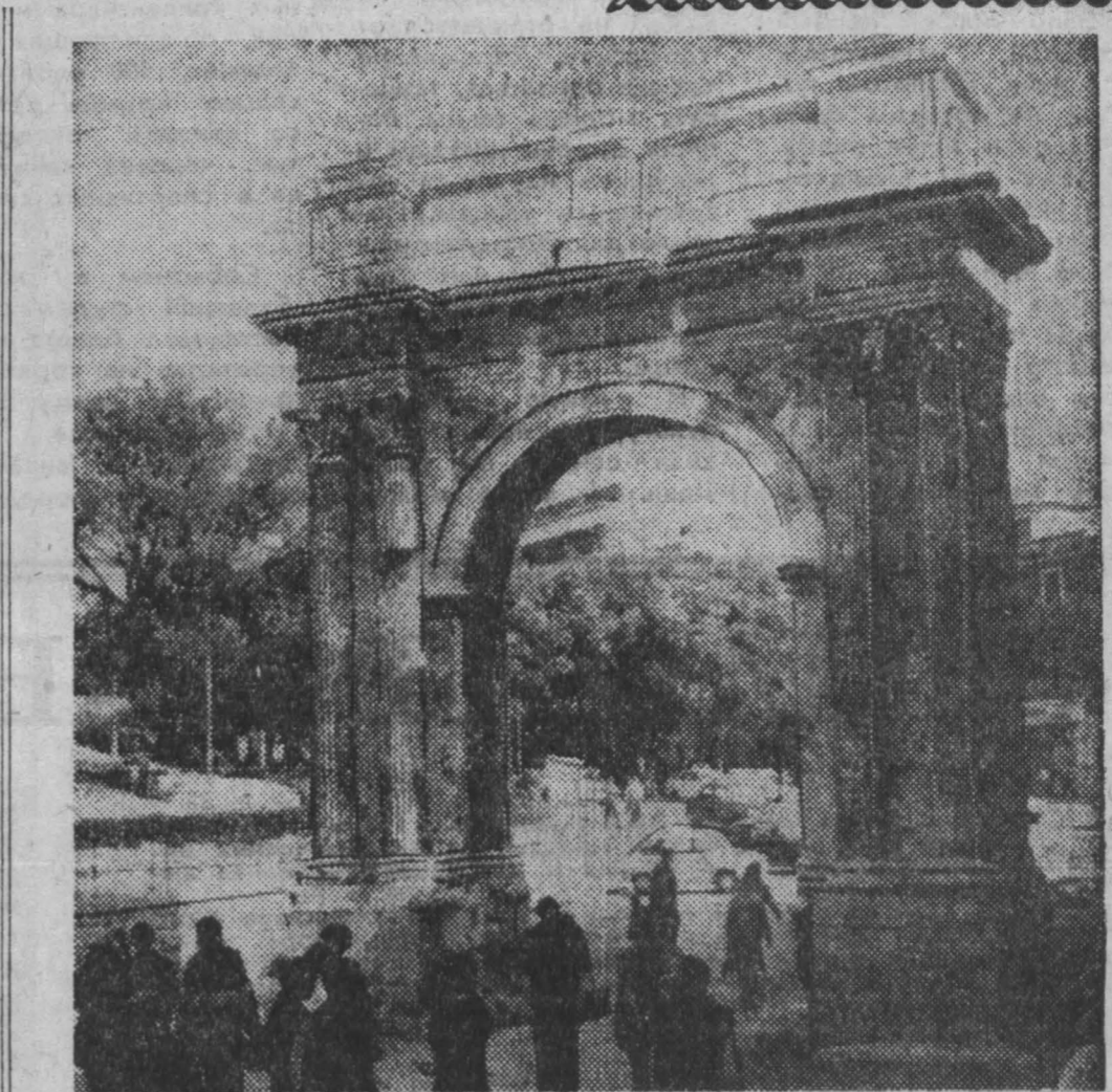
Социалистическая Федеративная Республика Югославия. За древними стенами города Пузы, южного порта на полуострове Истрия, расположены многочисленные памятники древнего Рима. Наиболее известный из них — Ворота Святого Сергия, относящийся к I веку нашей эры.

РАЗРАБОТАННЫЕ партией и государством меры создают условия для искоренения хулиганства и иных антиобщественных явлений, которым не может быть места в стране строящегося коммунизма.