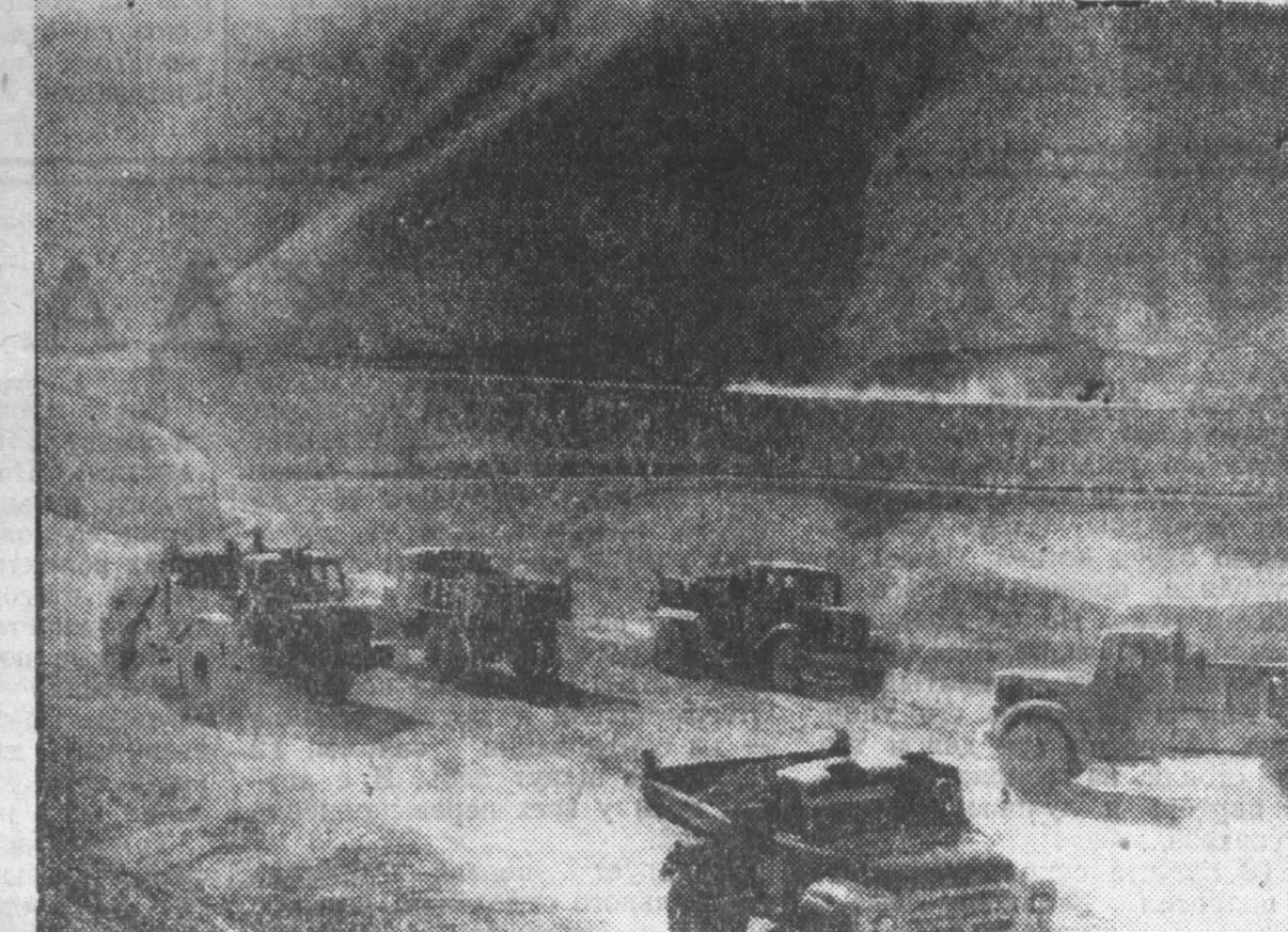
Ферганская область. Тысячи гектаров земель позволяют оросить Берниконское водохранилище. С окончанием строительства, которое завершится в нынешнем году, его вода вместит десяти миллионов кубометров воды. На снимке: на строительстве водохранилища.