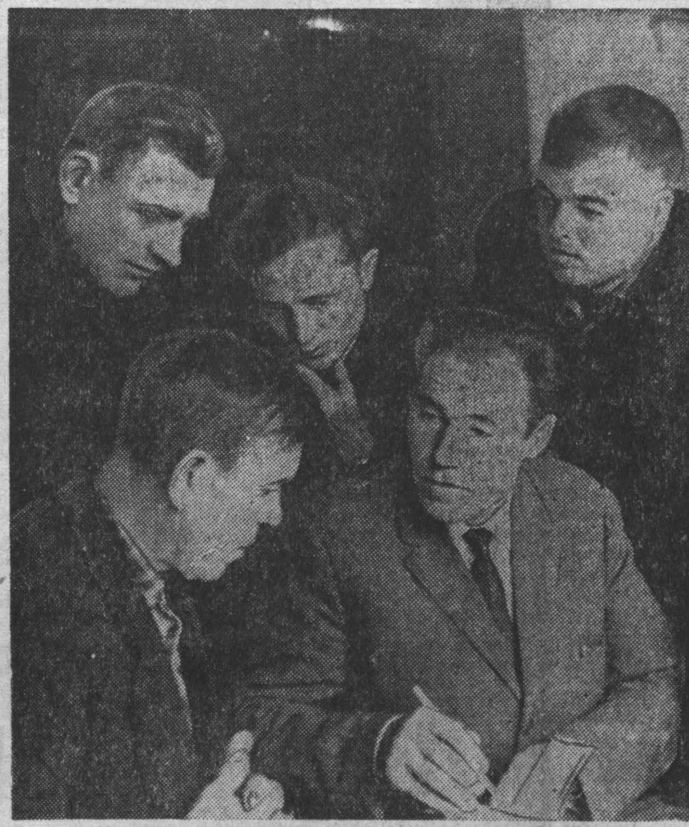
Позавчера в помещении областного драматического театра состоялся партийно-хозяйственный актив работников лесной промышленности Кузбасса.