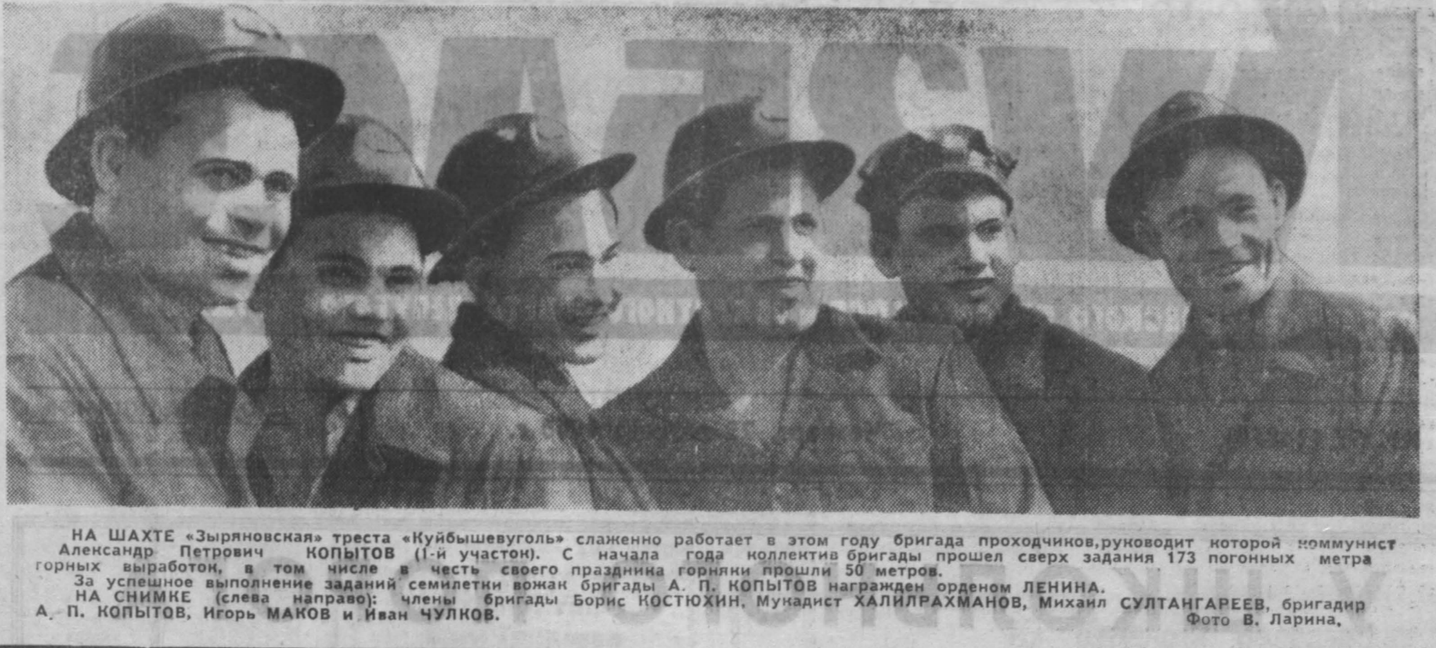
НА ШАХТЕ «Зырянская» треста «Куйбышевуголь» слаженно работает в этом году бригада проходчиков...