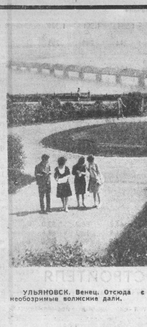
УЛЬЯНОВСКИЙ. Венец. Отсюда с высокого берега открываются необозримые волжские дали.