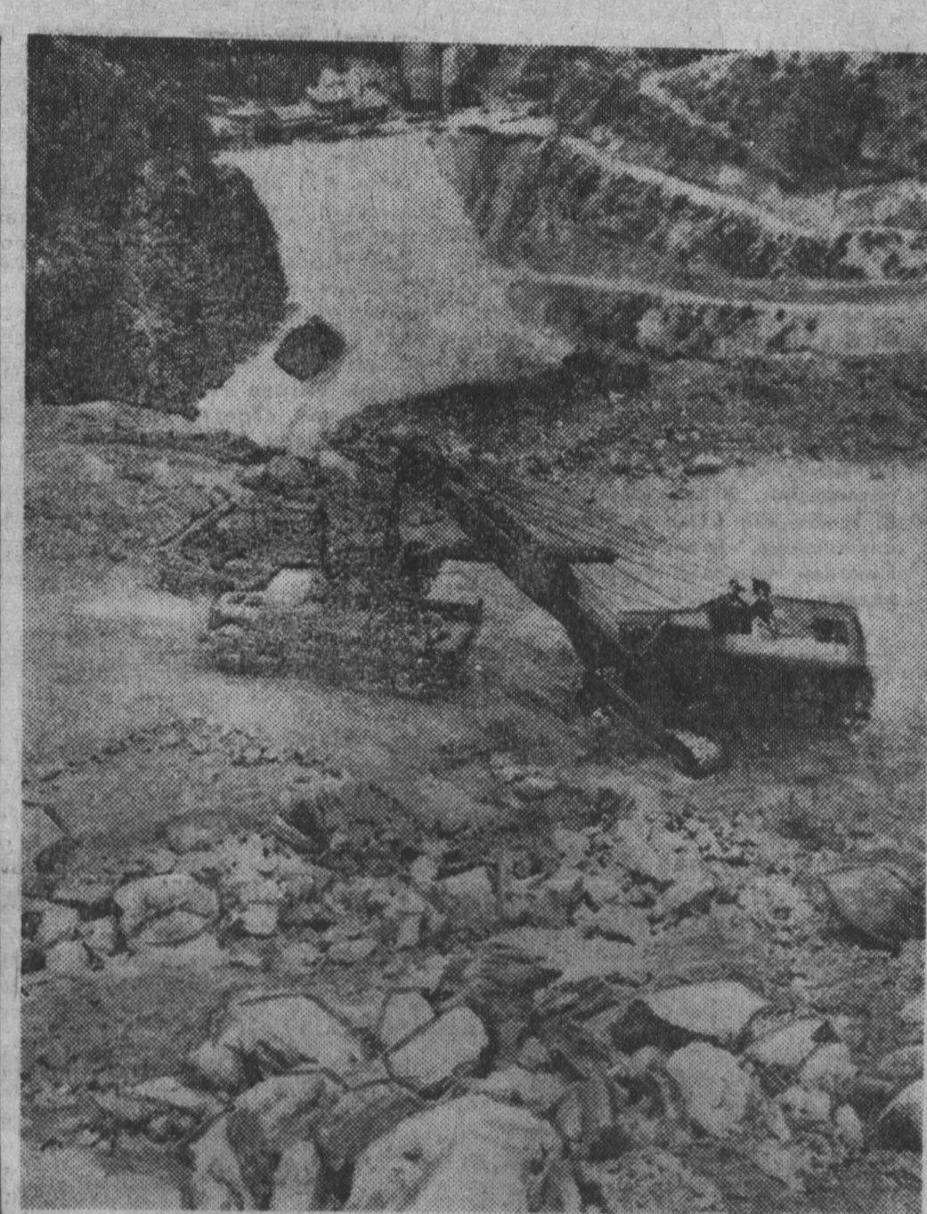
В некогда глухой Родопах на реке Выча сооружается самый мощный в Болгарии гидроэнергетический каскад...