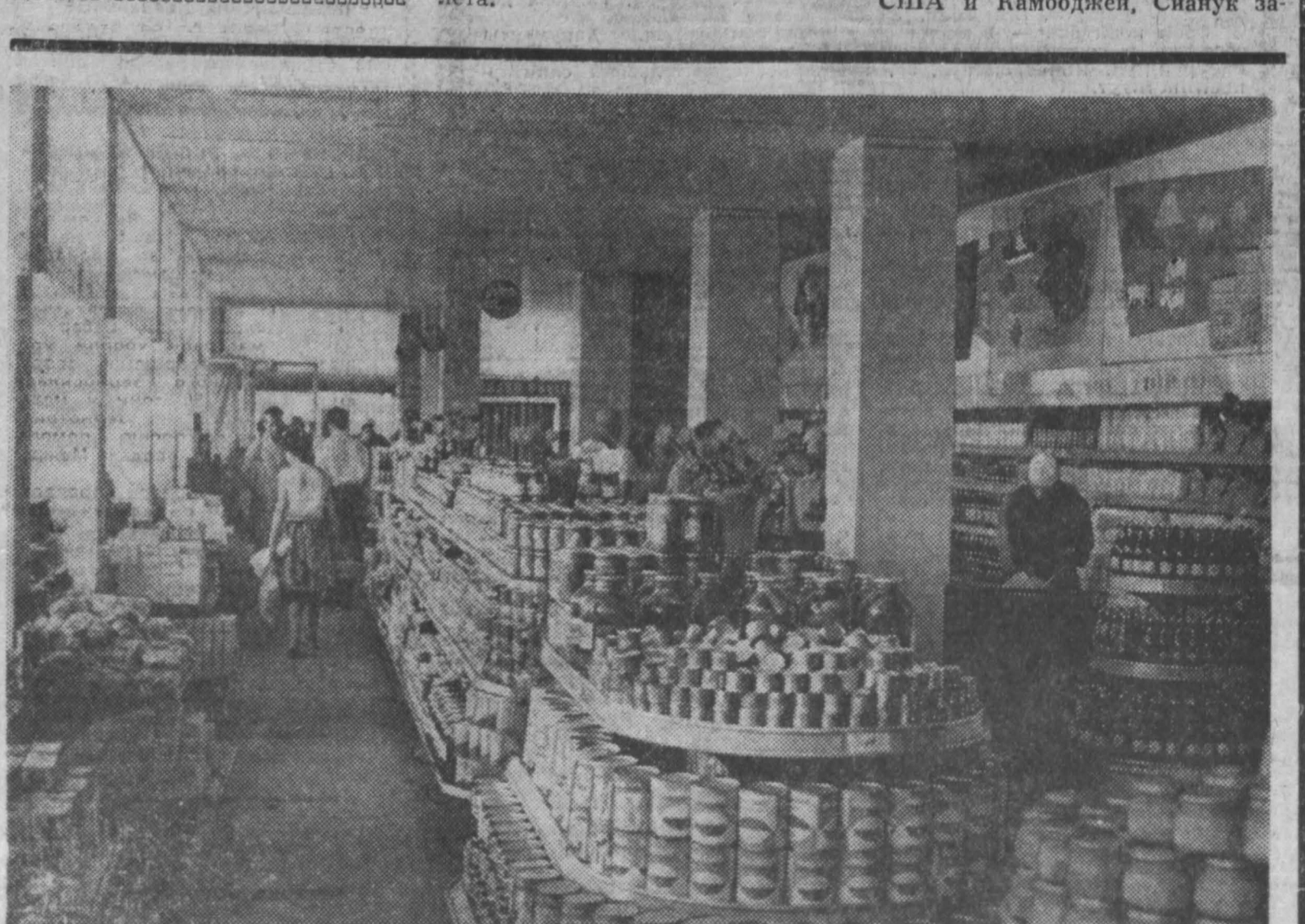
23 августа — День освобождения Румынии от фашистского ига. Национальный праздник румынского народа. НА СНИМКЕ: магазин самообслуживания в новом районе Бухареста...