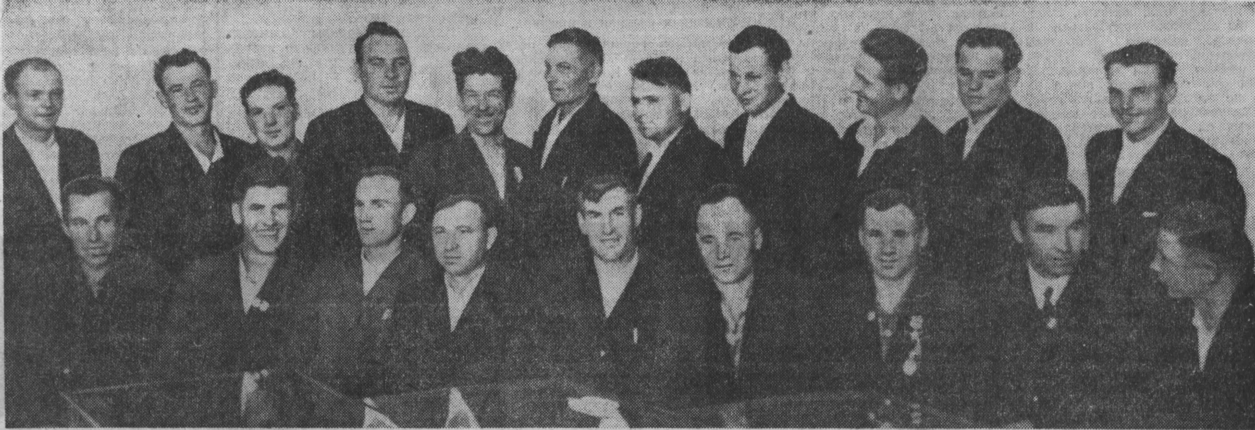
НА СНИМКЕ: группа механизаторов — инициаторов всекузбасского социалистического соревнования за успешное проведение уборки урожая.