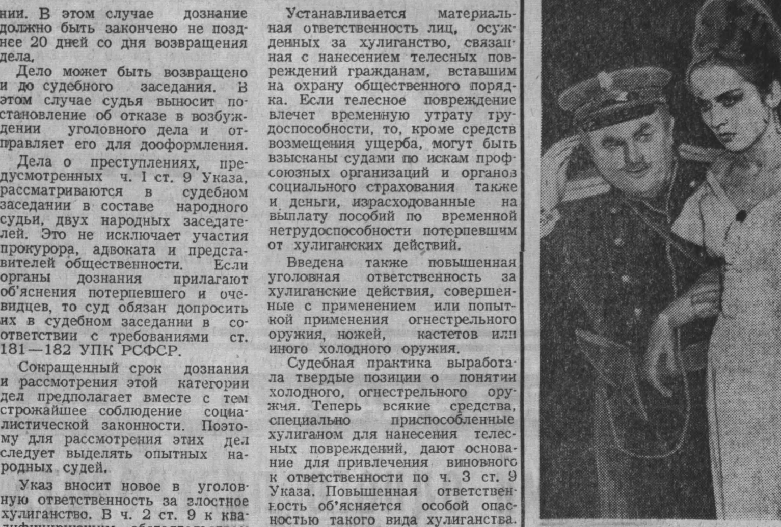
С большим успехом проводятся выступления в Кемеровском музыкально-драматическом театре им. Николая Островского.

Особое значение для судебной практики имеет ст. 16 Указа, устанавливающая правомерность всех действий граждан, когда эти действия направлены на пресечение преступных посягательств и задержание преступника, даже если при этом ему причинен вред.