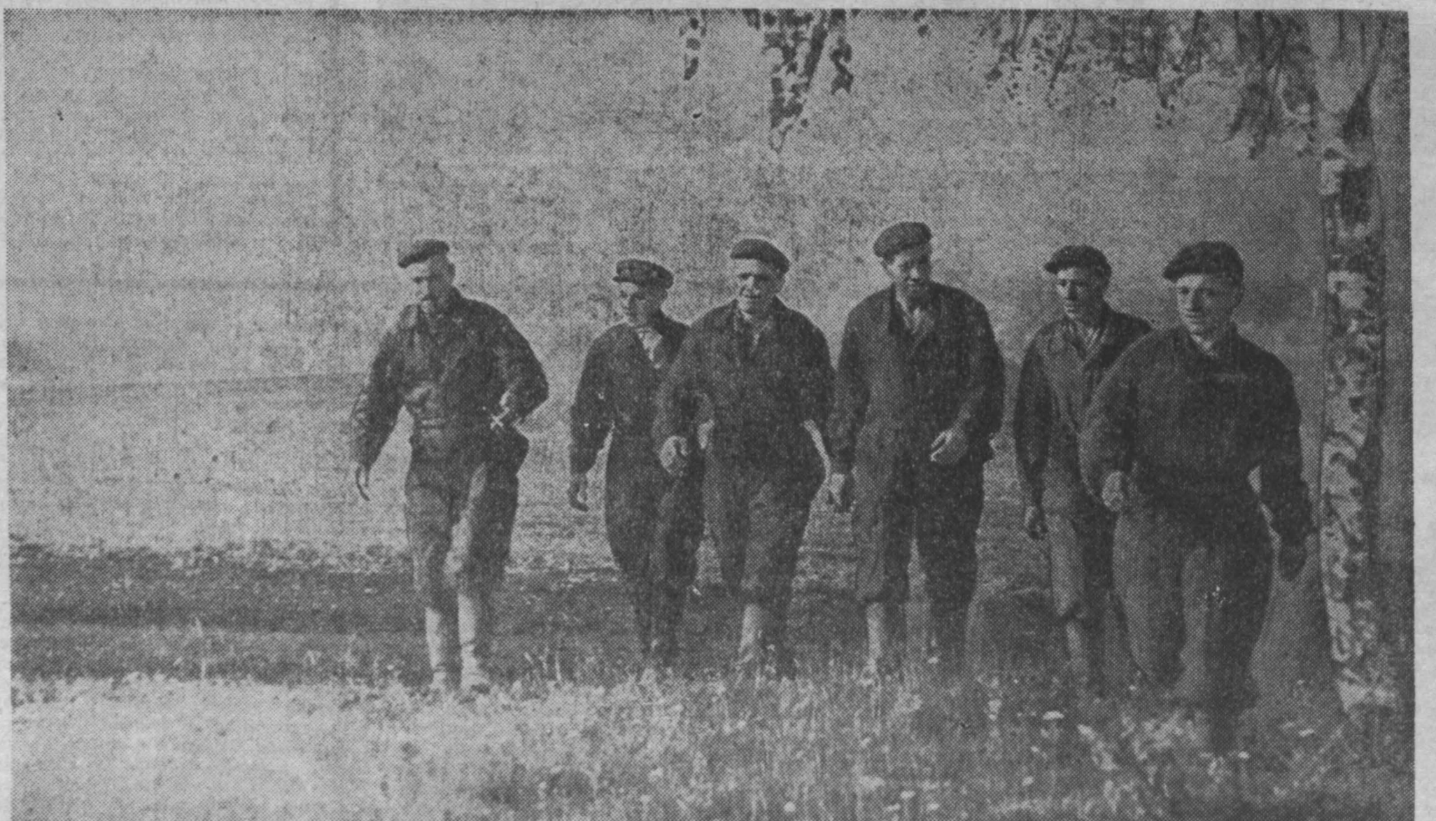
Механизаторы совхоза «Ступинский» во всеоружии встречают жатву. Уборочную технику они отремонтировали еще до дня открытия ХХIII с'езда КПСС. Их девиз: убрать все 9.000 гектаров хлебов в сжатые сроки и без потерь.