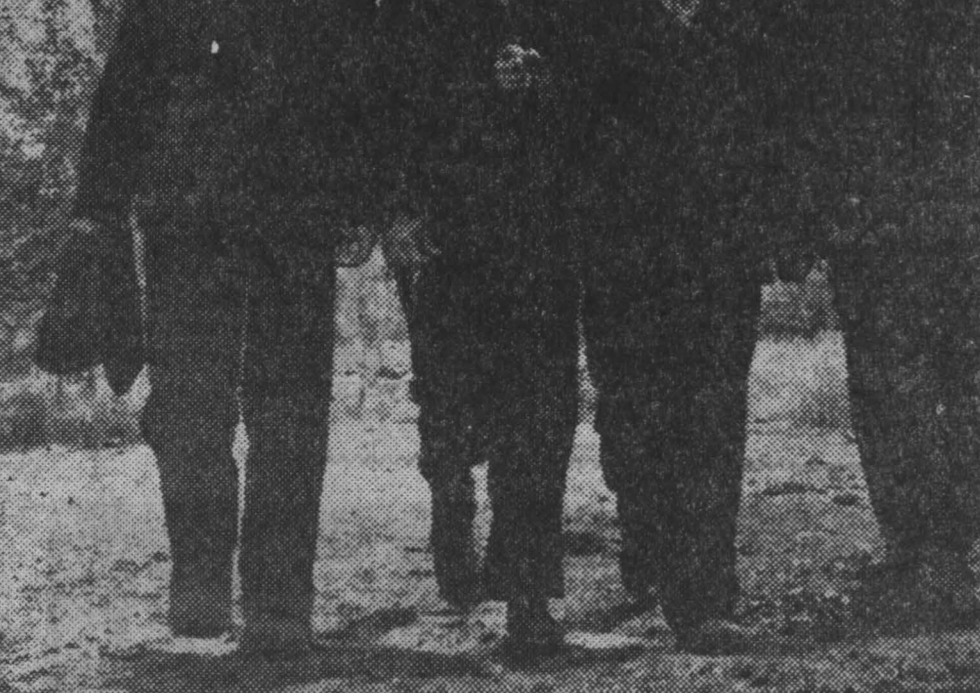
Хорошо работает коллектив комсомольско-молодежной печи № 5 первого цеха Кузнецкого завода ферросплавов.