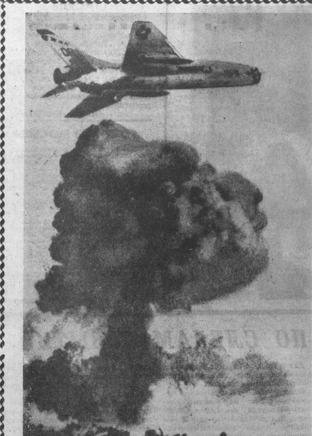
МОСКВА. В Центральном Дворце Советской Армии открылась фотовыставка «Вьетнам борется, Вьетнам побеждает».