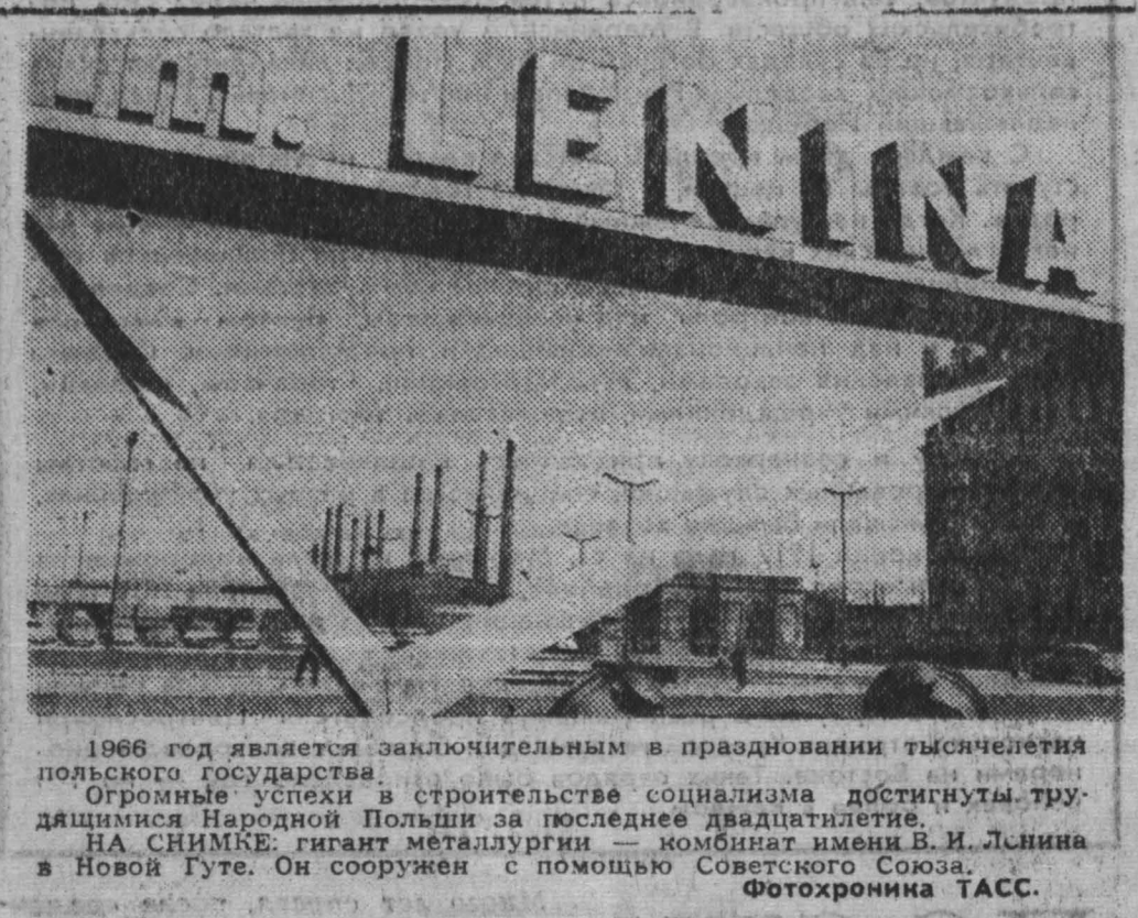
1966 год является заключительным в праздновании тысячелетия польского государства.