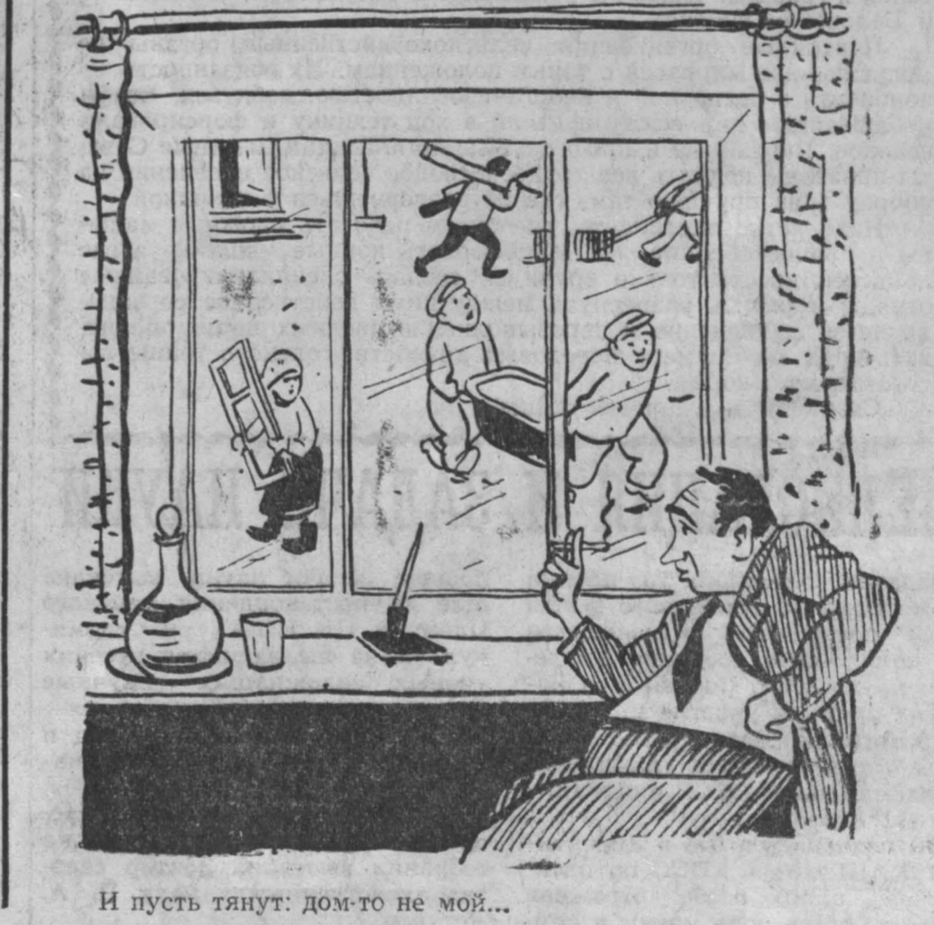
И пусть тянут: дом-то не мой...