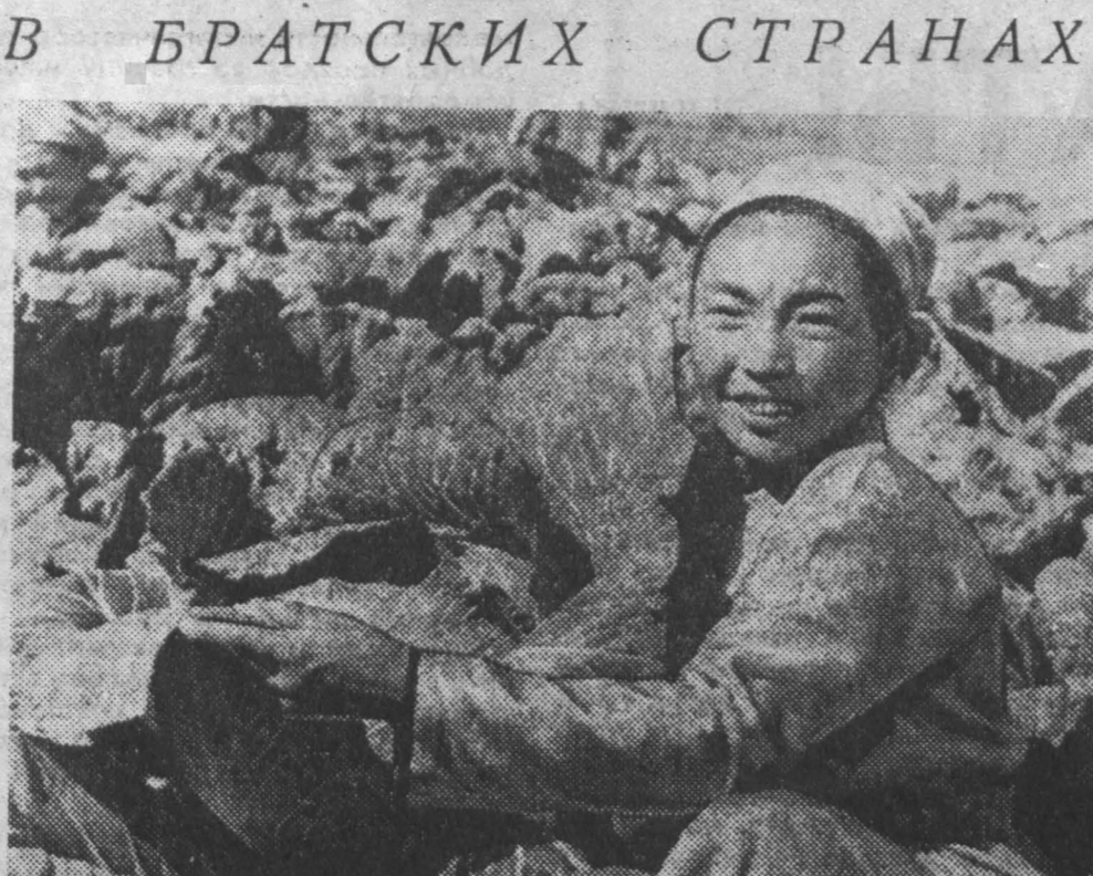
Земледелие в Монголии возникло в глубокой древности...

Сегодня же Председатель Совета Министров СССР А. Н. Косыгин возложил венок на могилу бывшего президента Финляндии Ю. К. Паасикиви.